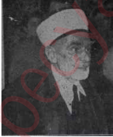
Eyüp Sabri Hayırlıoğlu Diyanet işleri reisi

Hafız yetiştirme. Kuram Kerimi başından sonuna kadar ezberlemekten maksat şunlar olsa gerekir: 1) Okuma yazma bilenlerin pek az olduğu, yazma kitapların tek tük ellerde bulunabildiği pek eski zamanlarda Kuran metninin tam olarak kafalarda mahfuz kalmasını ve böylece etrafa yayılmasını temin etmek; 2) Kuran okumanın ve okunurken dinlemenin bir ibadet sayılması. Birinci maksat baskı sanatının gelişmesi ile asırlarca evvel temin edilmiş bulunmaktadır.