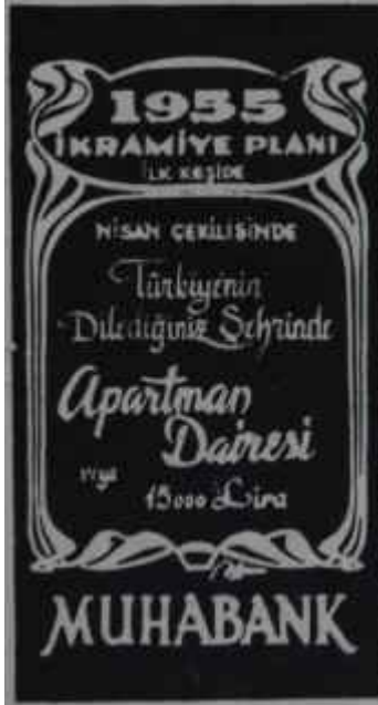
AKİS, 9 NİSAN 1955

Bu broşür bir "faaliyet" eseri idi, herkes, hazırlıyanlar, spiker adaylarına verenler iftihar ediyorlardı. Demek ki, radyoevi artık çalışmasını biliyordu, çalışmasının şekillerini sınıflandırmıştı, hattâ ve hattâ spikerlerimizin gülünç dereceye varan hatalarına meydan vermemek için böyle broşürler de hazırlıyordu. Ne icraat!..