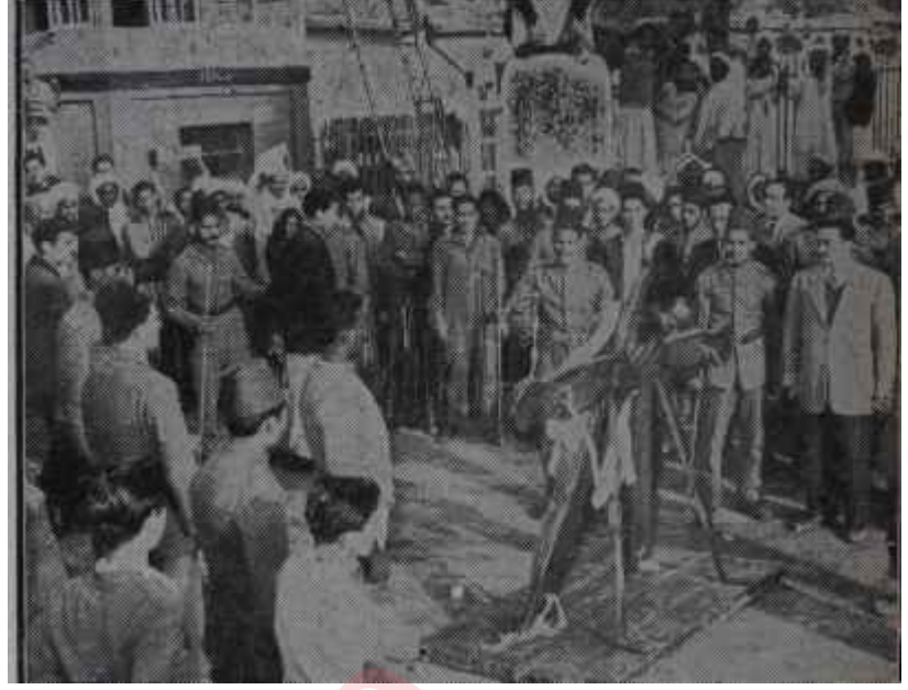
1955 senesinde falaka