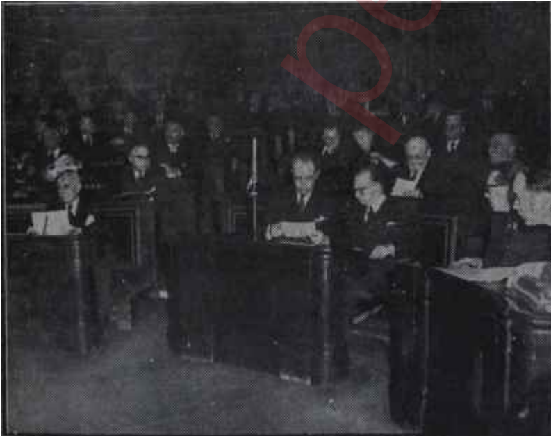
Faure ve Pinay Mecliste Fransa atomcu oluyor

Başkan Eisenhower Dışişleri bakanının fikrine geliyordu ama İngiltere'ye Başbakanı henüz kararım açıklamamıştı. İhtiyar Sir Winston, siyasi hayatını böyle bir konferansla kapamayı pek ziyade arzuluyordu? Bir bakıma acelesine sebep de buydu. Tehlikeli görmüyor veya görmezlikte gelmeyi tercih ediyordu. Fakat Sir Anthony ile ihtilâf halinde bulunduğu anlaşılmalı ve duyulmuştu. Muhafazakâr Parti, daha ziyade Dışişleri Bakanını tutuyordu. Zaten ihtiyar başbakanın artık yerini genç Dışişleri Bakanına bırakmasını da herkes biraz bu kapris'ler dolayısıyla tebalükle bekliyordu.