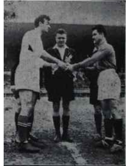
Millî takım kaptanları Başladıkları gibi bitirdiler

1 Nisan Cuma günü Futbol Federasyonu Başkanı Hasan Polat gazeteciler Cemiyetinde bir basın toplantısı yaptı. Saat 14,00 te üst salonda bütün spor yazarlarının hazır bulunduğu gözlen kaçmıyordu. Mevzu hakikaten cazipti. Federasyon başkanı çetin bir maç arefesinde yapılmış olan hazırlıkları açıklıyacaktı. Halinden iyi hazırlanmış olduğu anlaşılıyordu. Gazetecilerin huzuruna ilk defa çıktığı gibi heyecanlı geldi. Zaman nefesine olan hakimiyetini arttırmıştı. Hasan Polat söze