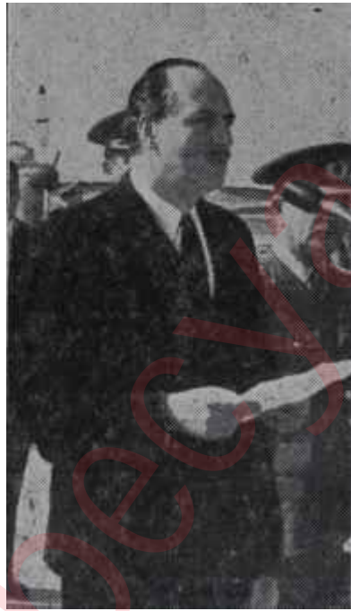
Fatin Rüştü Zorlu Liberasyon kahramanı

tır. Bu fikre iltifat etmek için bütçenin bir israf kaynağı olduğunu önceden kabul etmek lâzımdır. Onun için biz bu görüşe katılamıyoruz. Bir memlekette kanun yapanların herkesden daha fazla kanunlara riayet etmeleri gerekir. İşte bu yönden döviz bütçesi yapılırken herkesin doğru tahminlerde bulunması telkin edilirse biz ümit ediyoruz ki döviz bütçesi tarihiyle müsbet neticeler elde edilebilir. O zaman eldeki imkânlar göre şöyle bir liste yapılır ve denir ki evvelâ, ilâç, ham madde, devlet yatırımları ve hususi yatırımlar için istihsal vasıtaları ithal edilecektir. Bizim kanatımızca çıkar yol buradadır. Yani evvelâ vatandaşları fedakârlığa davet ve enflasyonist neticeler meydana