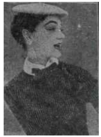
1 elbise — 4 giyim