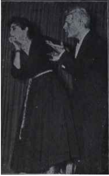
Cep tiyatrosu Ama henüz delik