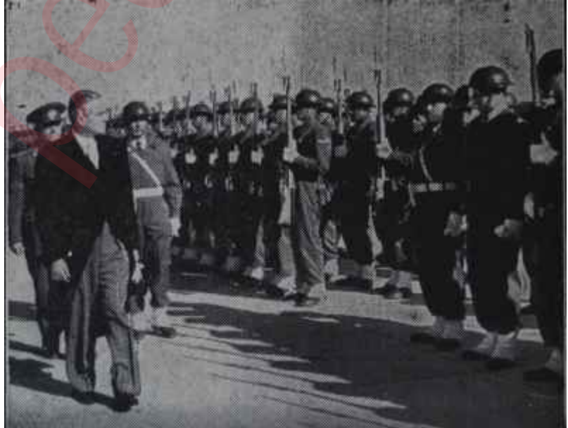
Lübnan Cumhurbaşkanı ve ordumuz Menfaat kuvvetinin yanında olmaktadır

Gazetecilerden biri Türk, diğeri Lübnanlıydı. Lübnan Cumhurbaşkanı bir yemeğin sonunda "kısırdılar" ve bir beyanat almaya muvaffak oldular. Doğrusu istenilirse, bu, öyle gönül rızasıyla verilmiş bir beyanat değildi. Hattâ hiç beyanat değil, sadece bir suale cevaptı. Ama, bir kaç gün müddetle Çankaya köşünde cereyan eden müzakerelerin mahiyetini izah bakımından alâka uyandırıcıydı. Camille Chamoun'un iki gazeteciye belirttiğine göre Türkiye ile Suriye arasında bir "küçük anlaşmazlık" vardı, şimdi o anlaşmazlık da ortadan kalkmıştı ve herşey normale dönmüştü. İki memleket, münasebetlerine devam edeceklerdi. Gazetecilerden biri "arabuluculuk" kelimesini ortaya attı. Misafir Cum-