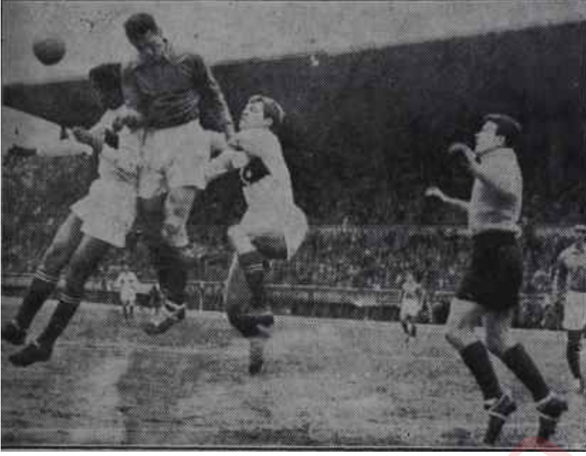
Türkiye - Fransa millî maçından görünüş Doksan dakika havaya kafa salladık