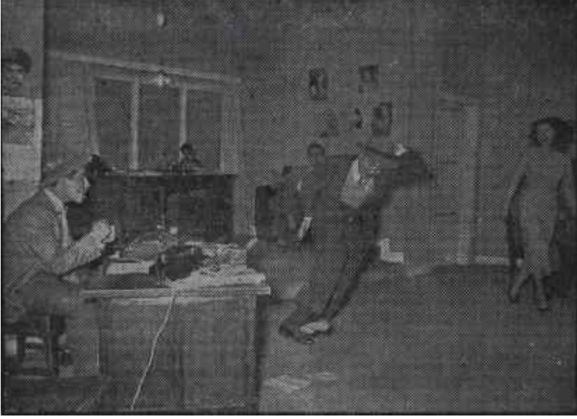
Güneşte on kişi İyi başladı, fena bitti