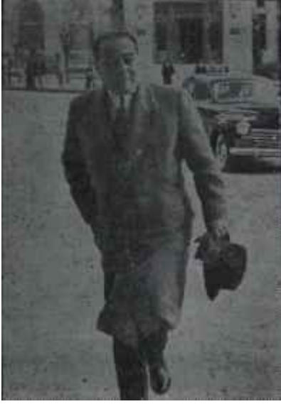
Adnan Menderes Selâma selâm

nımayacağını beyan etmişti. O söz ortada kaldıkça, tek elin saklamayacağı gibi tek tarafın yumuşamasının da memlekete ferahlık getirmeyeceği aşıkardı. Menderesi bahis mevzuu telgrafi Cumhuriyet Halk Partisinin Genel Sekreterine göndermeye hiç bir kanun mecbur etmiyordu.