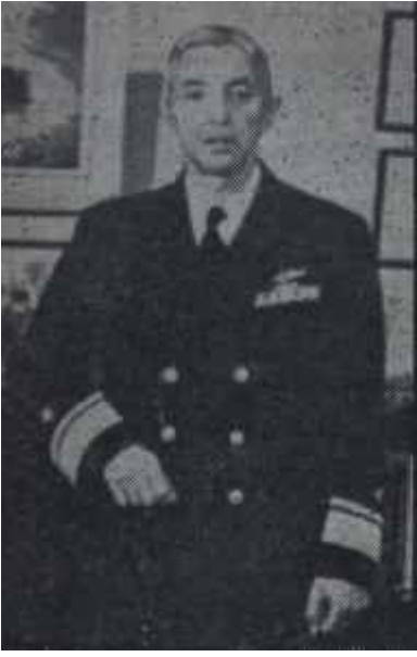
Amiral Rickover Nautilus'un babası

1953 Martında atom motoru yalnız başına çalışacak haldeydi 1954 Ocağında motoruyla beraber Nautilus denize indirildi ve bundan bir sene sonra şimdiki denize acildi.