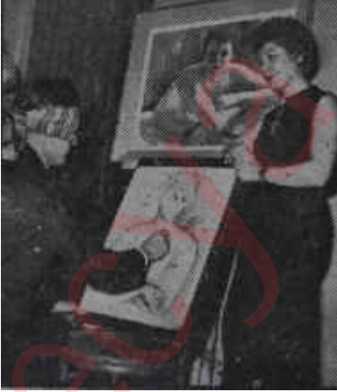
Gözü bağlı ressam