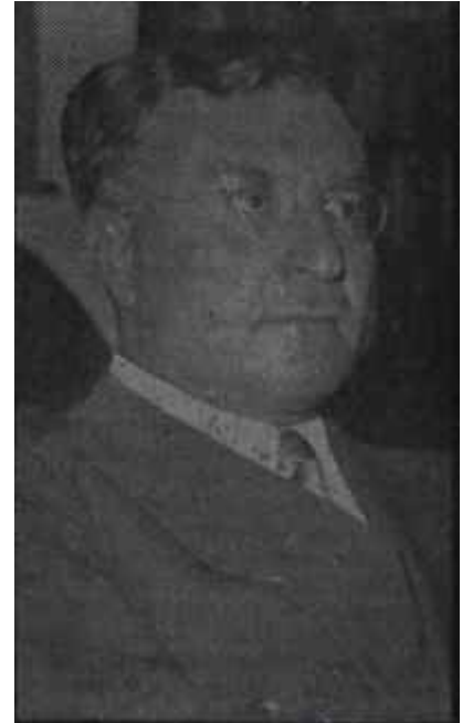
Kasım Gülek Artık ciddi bir muhalif

D oğrusu istenilirse Kasım Güleğin beyanatı, öyle harikulade bir beyanat değildi ve Cumhuriyet Halk Partisinin Genel Sekreteri her Türkün yapması gereken şeyden başka bir şey yapmamıştı. Muhalefet partisinin iki numaralı adamı da olsa, müfrit de tanınsa elbette ki vatansaver bir Türk Amerika'ya gidip memleketini çekiştiremezdi. Bu olsa olsa, aksi kanaatte bulunanlara muhalefetin de İktidar kadar vatansaver ellerde bulunduğunu ortaya koyardı ki böyle bir hakikatin anlaşılması başvekilin o telgrafi çektirecek kadar mühim görülmez. Zira bizzat Adnan Menderes bile bundan, elbette ki şüphe etmemektedir. Fakat Kasım Güleğin konuşması başvekilin Muhalefetin son hareketlerine sempatik ve teşvik edici bir cevap verme, hem de bunu kapalı kapılar arkasında değil milletin gözü önünde yapma imkânını sağlamıştı ve hâdisenin ehemmiyeti buradan geliyordu. Adnan Menderes bir tehevür altında iktidarın «kanuni mecburiyetler dışında» Cumhuriyet Halk Partisini ta-