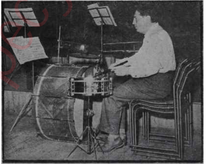
Ankara Radyosunda ıslahatın ilk neticesi Adam çıkarmaktan artık 1 davulcuya 3 iskemle düşüyor

Tıpkı basın gibi radyo da, ancak bu işin, sadece tekniğini değil, idaresini de bilen kimseler tarafından yürütüle-bilir. Eğer elde eleman yoksa, ihtisas için — ama ciddi ihtisas — Avrupaya veya Amerikaya adam göndermek bir zarurettir.