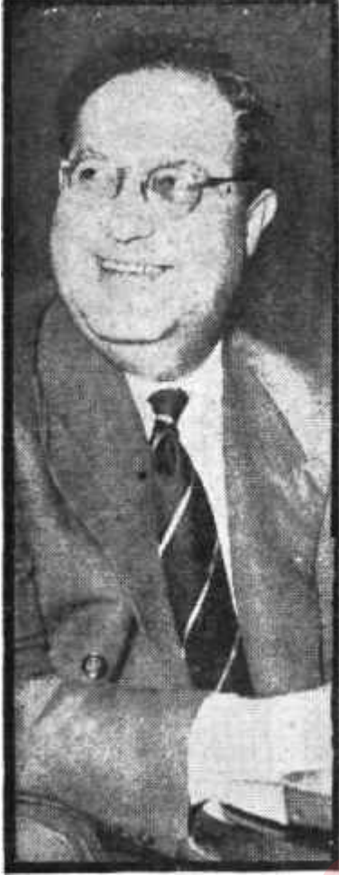
Ulvi Yenil Vur Abaltya!