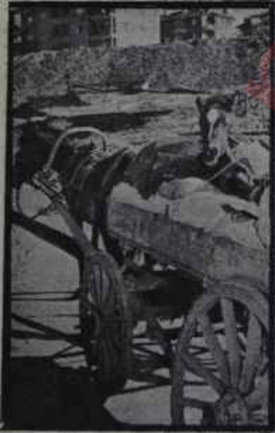
Tayını taşıyan at