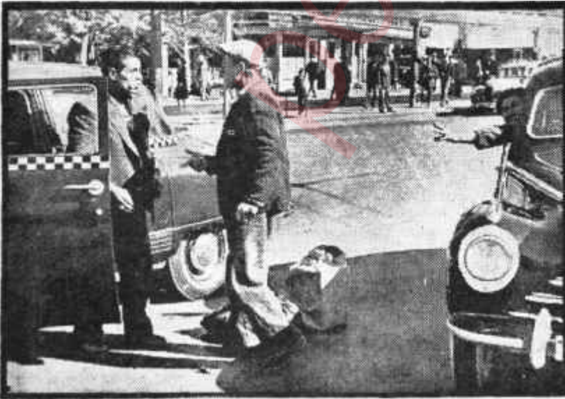
Ankaradan bir görünüş

Evet ise, kusura bakmayınız, çok fâsıfınız!