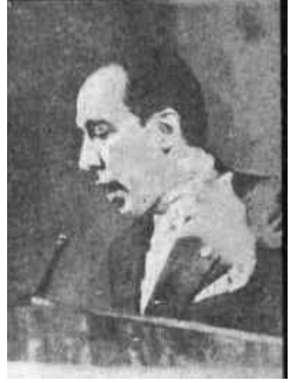
Guatemala hâdiselerinin üç kahramanı

Nikaragua Reiscumhuru Somoza — Müstevliilerin kumandanı Armas — Guatemala Hariciye Nazırı Toriello