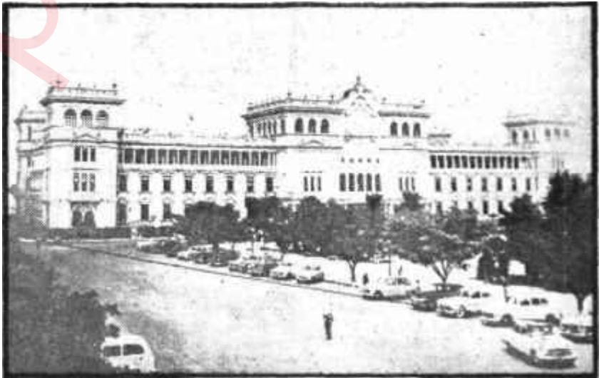
Guatemala hükümet konağı Direğe hangi bayrak çekilecek?