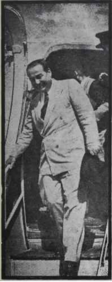
Başvekil Menderes Söz Düellosu Şampiyonu