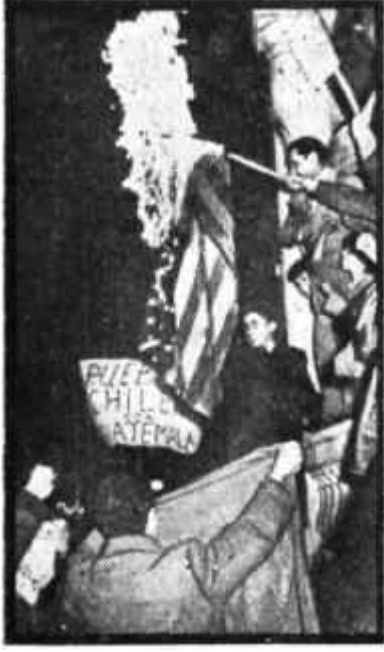
Şilide Amerikan bayrağı yakılıyor Ateş yayılıyor mu?