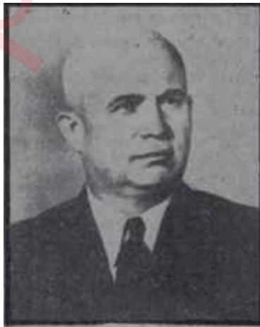
Krutçev Kızıl Velihaft

zum görülmeksizin) Jeoloji Vekâleti lağvedilmişti. Bugün bu vekâlet tekrar ihdas edilerek başına Antropof getirilmektedir. Elektrik santralleri ile ve elektrik endüstrisi ile meşgul olmak için tek bir vekilin kâfi geleceği zannediliyordu. Bugün durum değişmiştir. Bu iki saha ayrı ayrı vekillere tevdi edilmiş bulunuyor.