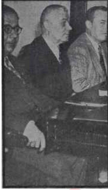
Dr. Behçet Uz

Eski C.H.P.; Yeni D.P. Sağlık Vekili nin, hattâ daha da süratli şekilde devam edeceği bildirilecektir.