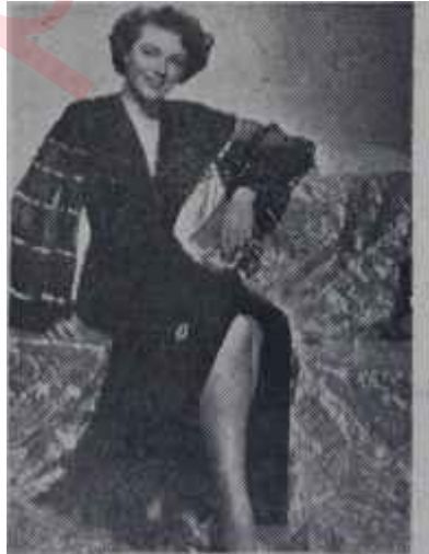
Dördüncü Buud Her kadın erişebilir

Boyunuzun daha uzun görünmesi için tek renkli elbiseler ve rödengotlar giyiniz; dar kemerler takınız; sivri şapkalar ve küçük aksesuarlar kullanınız. Ayakkabınızın ökçesi ne yüksek, ne de alçak olsun; nihayet saçlarınızı kısa kestirin ve çok itina ile tarayınız.