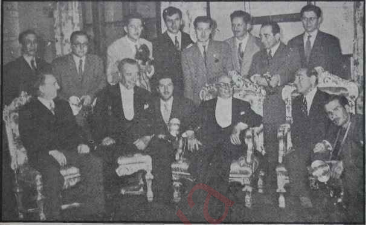
Dört kurucu Ve fotoğrafçılar Koraltan niçin koltukta değil?

ları, bilmeyen — eski Vekiller dahil — öteki mebuslardı. Bu bakımdan, pek çok kişinin gönlünde aslan yatıyordu.