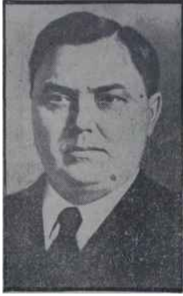
Malenkof Kızıl Çar III

Her halde, sonradan, merkezîyet sisteminin, vekâletlerin birleştirilmesinin faydasından ziyade malzur olduğunu neticesine varılmış olacak ki, 1953 martında kurulan sistem çok devam etmedi ve tekrar vekâletlerin çoğaltılması yoluna gidildi. Malenkof, aradan bir yıl geçmeden, Stalin an'a-