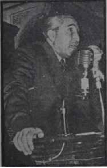
Osman Bölükbaşı Mecliste Üçüncü Adam