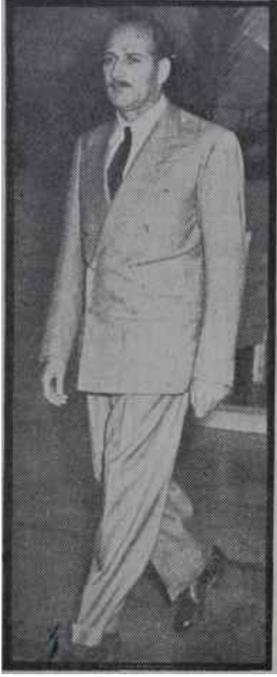
Fatin Rüştü Zorlu