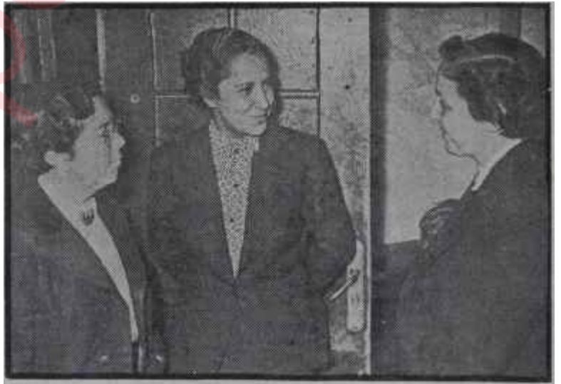
Kadın Mebuslar "Les Trois Graces"

"— Cumhuriyet Halk Partisi şu anda, içinden ölü çıkmış bir eve benze-