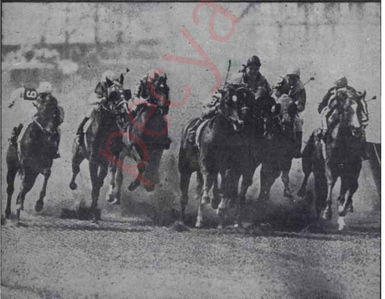
İngilterede At Yarışı Bu resim Sanat sayfasına girebilirdi