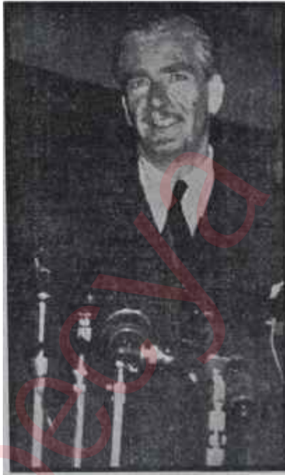
Anthony Eden Konferansın ara bulucusu

Vietnam delegesi bir takrir verdi. Bu takirde, sukut etmiş olan Dien-Bien-Fu müstahkem mevkiindeki ağır yaralıların biran evvel tahliyesi için bir mütareke akdedilmesi ve bunun müstaceliyetle görüşülmesi isteniyordu. Oturuma başkanlık eden Sovyet Hariciye Murahhası bu takriri alkoydu; fakat muhtevasını açıklamadı. Buna mukabil derhal Vietmin murahhasına söz verdi. Vietmin Murahhası da mütareke meselesinin derhal görüşülmesini istiyordu. Hayret!... Vietnam murahhası kendi takririnde de aynı talebin bulunduğunu, Molotof'un bunu açıklamadan evvel Viet-