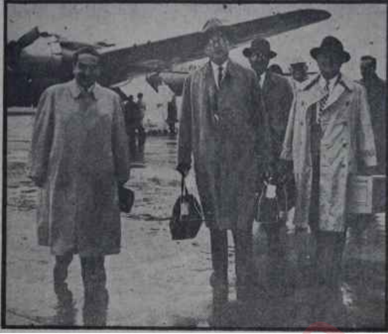
Amerikalı İş Adamları Türkiye'de Business is Business

Amerikan iş adamından müteşekkil bir gurup gelecektir.