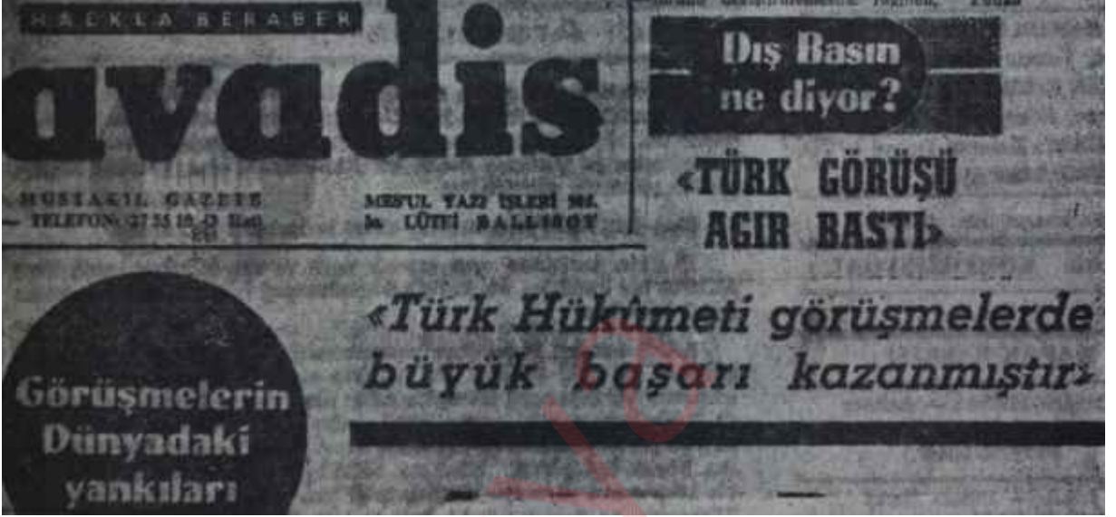
Yağcı gazetelerde Keşan Randevusu ile ilgili haberler Sap derken saman diyenler