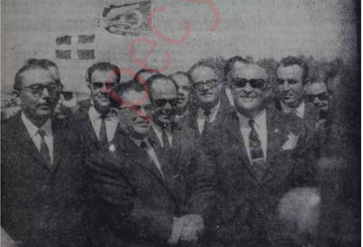
Keşanda Türk ve Yunan Başbakanları Dostlar alışverişte görsün!

Herşeyi dürbünün tersmden görmeye alışmış amerikalıların söylediğine bakılırsa, bu plânın o zamanlar başarısızlığa uğramasının nedeni, Papandreu tarafından, daha görüşmelere konu olmadan kamuoyuna sızdırılmış olmasıydı. Fakat amerikalıların, Papandreunun bunu kamuoyuna sızdırmak cesaretini nereden bulduğunu düşündükleri yoktu. Eğer ihtiyar politikacı, ken-