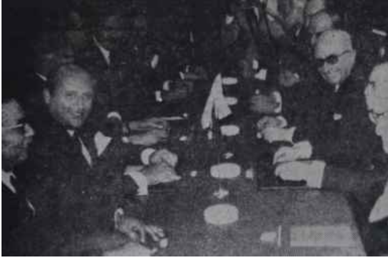
Türk ve yunan heyetleri toplantı halinde Havanda su dövdüler

disinde ikinci Acheson plânını torpillemek cesaretini bulduysa, bunun nedeni, Birleşik Amerikanın o sırada Yunanistana sağladığı dokunulmazlık kalkıyordu. Gerçekten, Washington, NATO'nun güneydoğu kanadını korumak maskesi arkasında Türkiyeyi Kıbrıs müdahale etmekten alakoyarken, öteyandan, böylece, Türkiyenin elinden, Papandreuyu görüşmeye zorlayacak en önemli kozu da almış oluyordu. Oysa şimdi, Ankarada ve Atinada kendine çok yakın kimseler işbaşında olduğuna göre, sözlerinin dinleneceğinden emin, ikisinin de arkasını sıvazlayabilirdi.