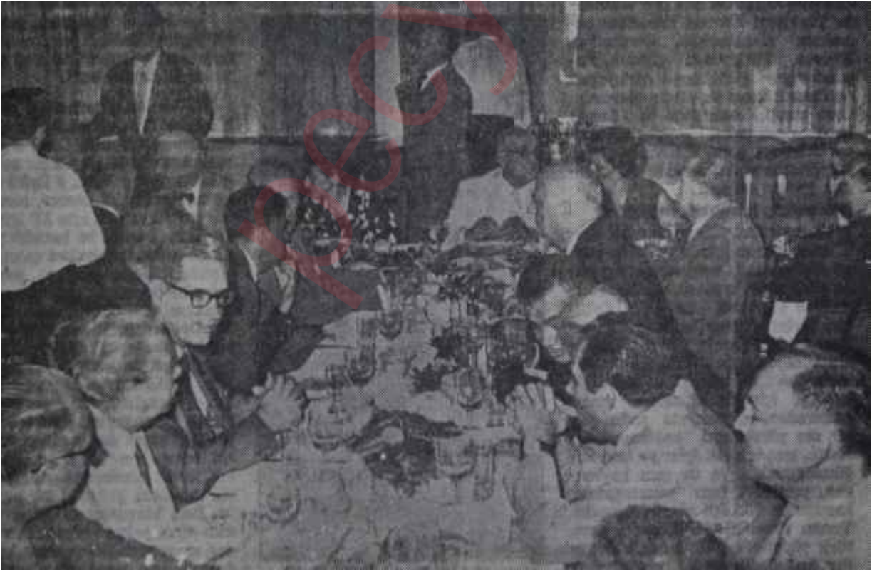
Celâl Bayar, şerefine verilen ziyafette Eski mal, işbaşında..

Bayar, İzmirde, -bundan bir ay önce bu dergide (Bak: Sayı: 687