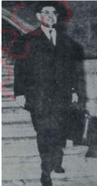
Yunanistan Başbakanı Kollias İpler kimin elinde?

"— Vallahi kardeşim, ortalıkta pek birşey yok ama, şu yeni yunan idarecileri nasıl şeylermiş, onu bir