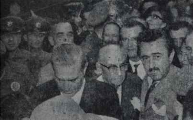
Bayar İzmirde karşılanıyor Kampanya açılıyor