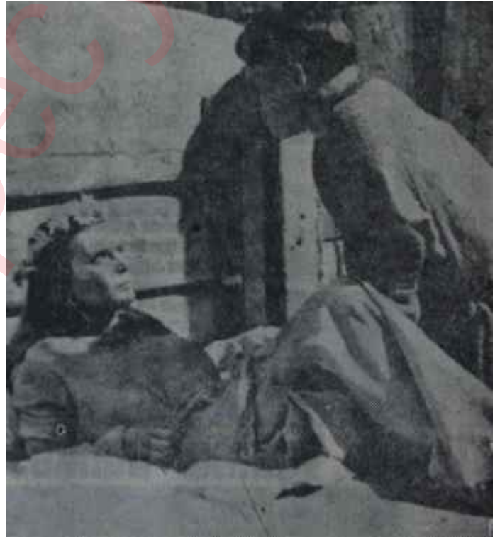
Bir "Sağlam film" Ne zamana kadar?

Hasılatdaki bu artış, özellikle son yıllarda sürekli olarak zarar eden büyük yapımcilerinin kâra geçişi, çok tehlikeli, fakat şimdiye kadar henüz bir aksaklık göstermemiş olan yeni bir yapım siyasetinden doğ maktadır. Bu yeni. yapım siyaseti, şimdilik yılda yarım düzine ile bir düzine arasında "sağlam film" mey dana getirmekten ibarettir. Piyasa nın talep ölçülerine göre hazırlanan bu "sağlam film"ler, aslında yeni bir şey değildir. Hollywood'un öte denberi, normal yapım arasında yer verdiği "üstün-yapımlar" bunlar dan hiç de farklı değildir. Farklı olan taraf, bu filmlerin piyasaya sür ü lüş tarzındadır ki, filmin' "sağ lam" lığı da zaten bundan ileri gel mektedir. Bu 'yeni sürüm siyaseti şöyle işlemektedir: Büyük şirketler, bir yıl sonrasının programı için lis telerinde, büyük bütçeli, kalabalık yıldız kadrolu bir listebaşı filmine yer vermekte, bunlar için Amerika nın her büyük şehrinde bir "kilit sinema"yı bir yıl öncesinden peyle mektedirler. Bu sinemaların bilet