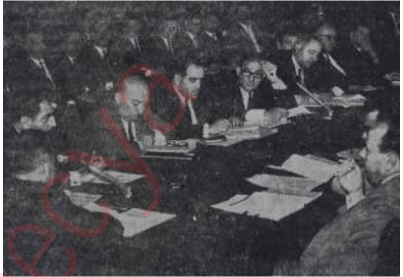
Bakanlar ve Özel sektör temsilcileri birarada Anlaşmalar buluşurlar

Türkiye Ticaret Odaları, Sanayi Odaları ve Ticaret Borsaları Birliği Başkanı Sırrı Enver Batur, oturmakta olduğu koltukta gür bıyıklarına gereken düzeni verdikten son-