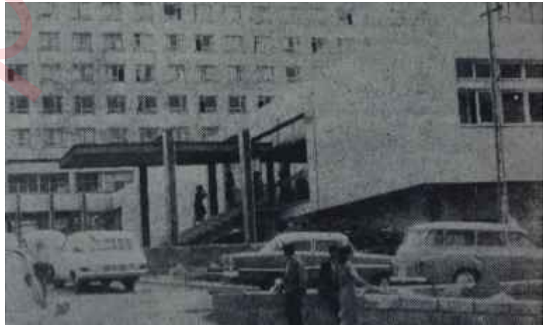
Hacettepe Tıp Fakültesi binası İş bilenin...

Doğramacı ve Hacettepenin önceki yöneticileri, Hacettepe Bilim Merkezi Tesisinin Üniversite yönetimi ile ilgili olmadığını, Üniversitenin kurulması için Maliye Bakanlığınca