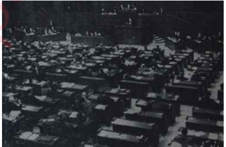
Mecliste milletvekilleri Yeme de yanında yat!

"— Bu toplantı yılında Meclisimiz 150 birleşim aktetmiş ve cem'an 790 saat çalışmıştır. Bu netice, geçmiş bütün yıllara nisbetle en