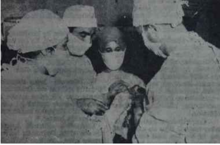
Hacettepe Tıp Fa kütlesinde faaliyet El işliyor, dil övünüyor ama..

kanalı ile Karşılık Paralar Fonundan 29.5 milyon liralık düşük faizli borcun alınabilmesi amacıyla bu tesisin kurulduğunu ifade etmişlerdir. Gerçekten de Üniversiteler Kanununda bir "mütevelli heyet" yoktur. Ancak, Hacettepe Bilini Merkezi Tesisi Mütevelli Heyetinin Üniversiteye hiç tesir etmeyeceğini söylemek fazla iyimserlik olur.