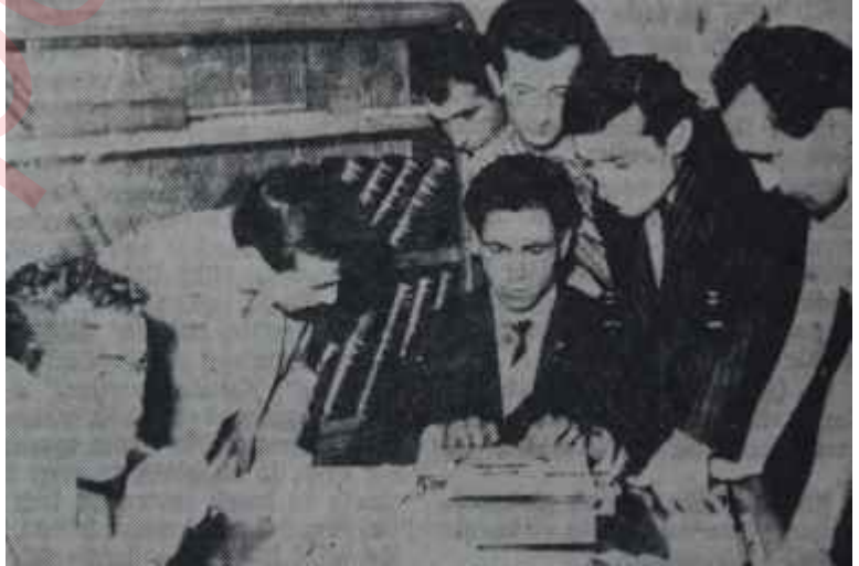
A.Ü.T.B. binasında İcra memurları Bükemedikleri kolu kırmağa çalışanlar

Ancak bu, tek taraflı bir hesaptır. İktidar sorumlularının bir özelliği de, işte bu gaflettir.