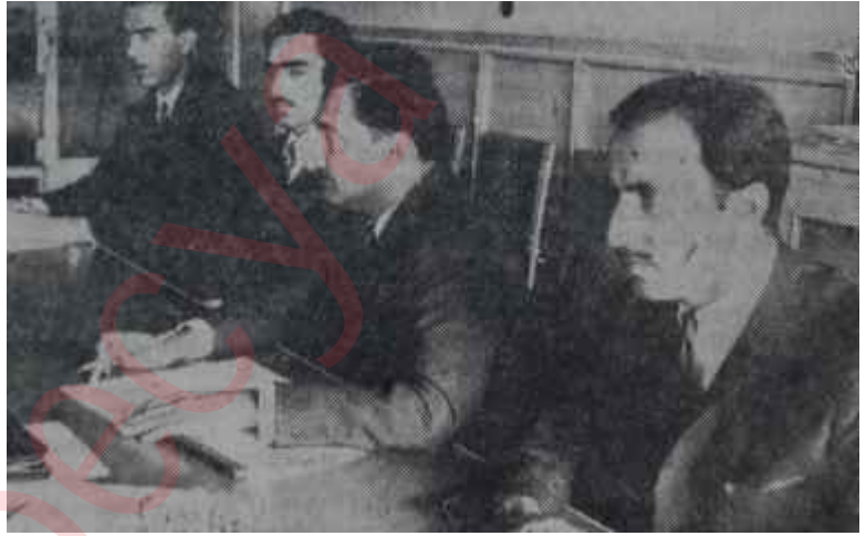
Ecevit, depremle ilgili basın toplantısında

Herkes kendi derdinde Halk, böyle mazeretlere inanmamaktadır. Adapazarı depreminin üzerinden bir hafta geçmiş, olmasına rağmen şehir içindeki enkazın bile kaldırılmamış olması, halkın bahçelerde ve parklarda çadırsız yatması, bazı yerlerde ekmek sıkıntısı çekilmesi ve hele köylere hiç-