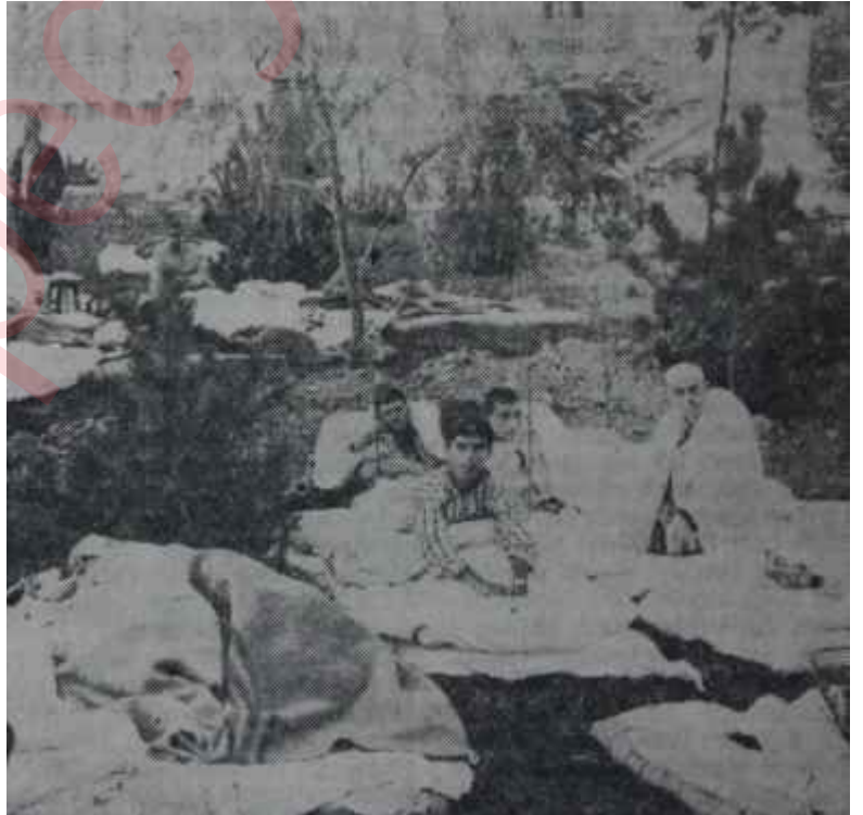
Adapazarında parklarda depremzedeler İşte gerçek manzara!

Hangi tarafından bakılırsa bakılınsın, AP İktidarının bu işlerin içinden çıkması mümkün değildir.