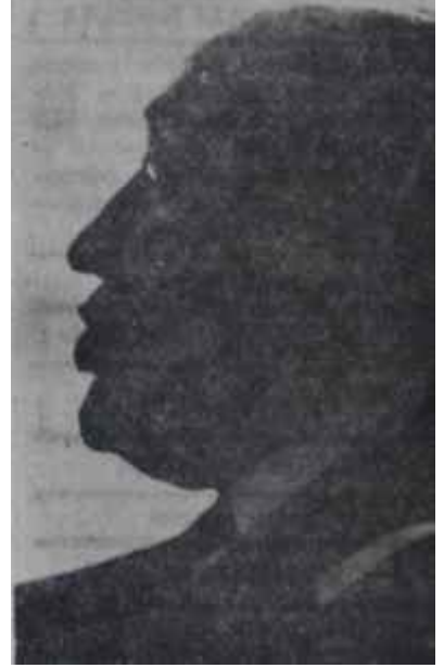
Bülent Ecevit - Süleyman Demirel "Böyle gelmiş, böyle gitmez"