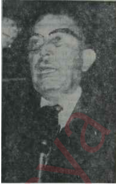
İhsan Sabri Çağlayangil Ters işler

Hazin olan, bir Dışişleri Bakanının ve -ziyaretinin uygunluğunu danıştıysa- bir Dışişleri Bakanlığı-