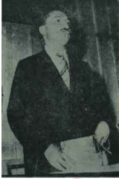
Bülent Ecevit Sessiz, fakat emin

"—Neticede gördük ki, herkes kendi işine baksa, bu mesele yoluna girecek. Bir de şu var: bu 8ler bizi kelle gibi görüp cesaretleniyorlar. Onlara gittik, 'siz bize güveniyorsunuz. Eğer şu ilk Parti Meclisi toplantısında kalkıp, bu mesele çok kötü bir hal aldı, ne kadar konuşulsa o kadar sertleşecek, çatışmayı Kurultaya kadar kapatalım, müşahhas meseleleri görüşelim, çalışmalarına bakalım demezseniz bizi arkanızda bulamazsınız' dedik. Eğer bunu yapmazlarsa, Grup yöneticile-