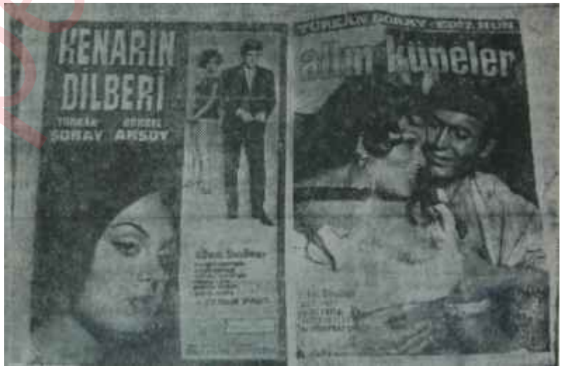
Bizim filmlerimizin afişleri Herkes gider Mersine, biz gideriz tersine

Derginin ikinci sorusu, ulusal bir yardım düzeninin bulunup bulunmadığı, varsa bu yardımın hangi kaynaktan sağlandığı konusun-