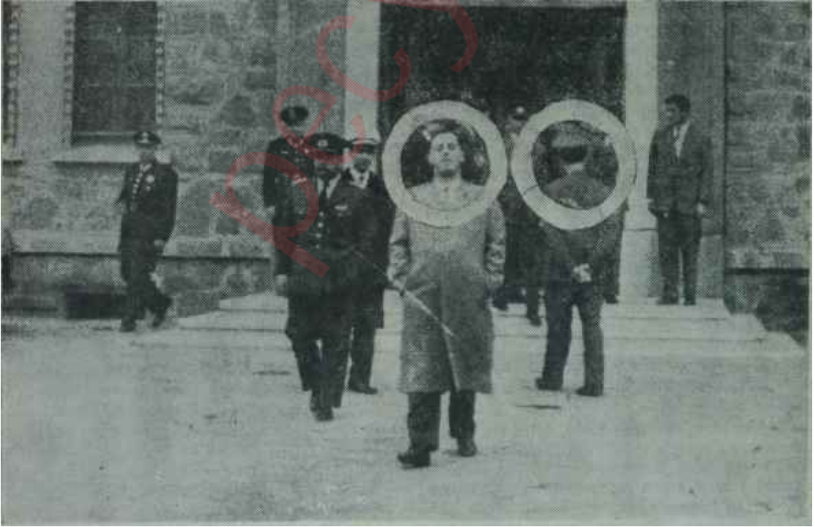
13 Kasım sabahı, 14'ler için tam bir sürpriz teşkil etti. Cemal Gürsel azledilen M.B.K. üyelerine evlerinden çıkmamalarını bildirdiyse de bunlardan ikisi, Dündar Taşer ve Muzaffer Özdağ sokağa fırladılar ve soluğu Meclis binasında aldılar. Ancak Mecliste, artık dost yüzler yoktu. Gençlik ve halk ise, radyodan haberi duyduğundan bu yana gerçek bir ferahlanmanın içindeydi.