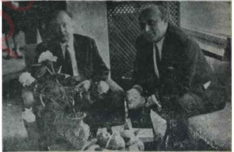
Demirel, Çınar Otelinde, A.P. İstanbul İl Başkanıyla Hem ziyaret, hem ticaret

Başbakanın, bu haftanın ilk günü İstanbul'dan ayrılırken, Yeşilköy Havaalanında ayaküstü sebil ettiği vaitleri de, memleketin şu andaki durumunu bilenler arasında gülümsemelere yol açtı.