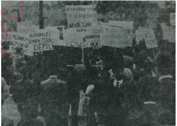
Amerikan aleyhtarı miting başlıyor Ne istendi, ne yapıldı?

Ama Türkiyenin gerçeklerine doğru bir teşhis konulacaksa, önce başın kumdan çıkarılması ve ondan sonra, gerçeklerin icabının yapılması lâzımdır.