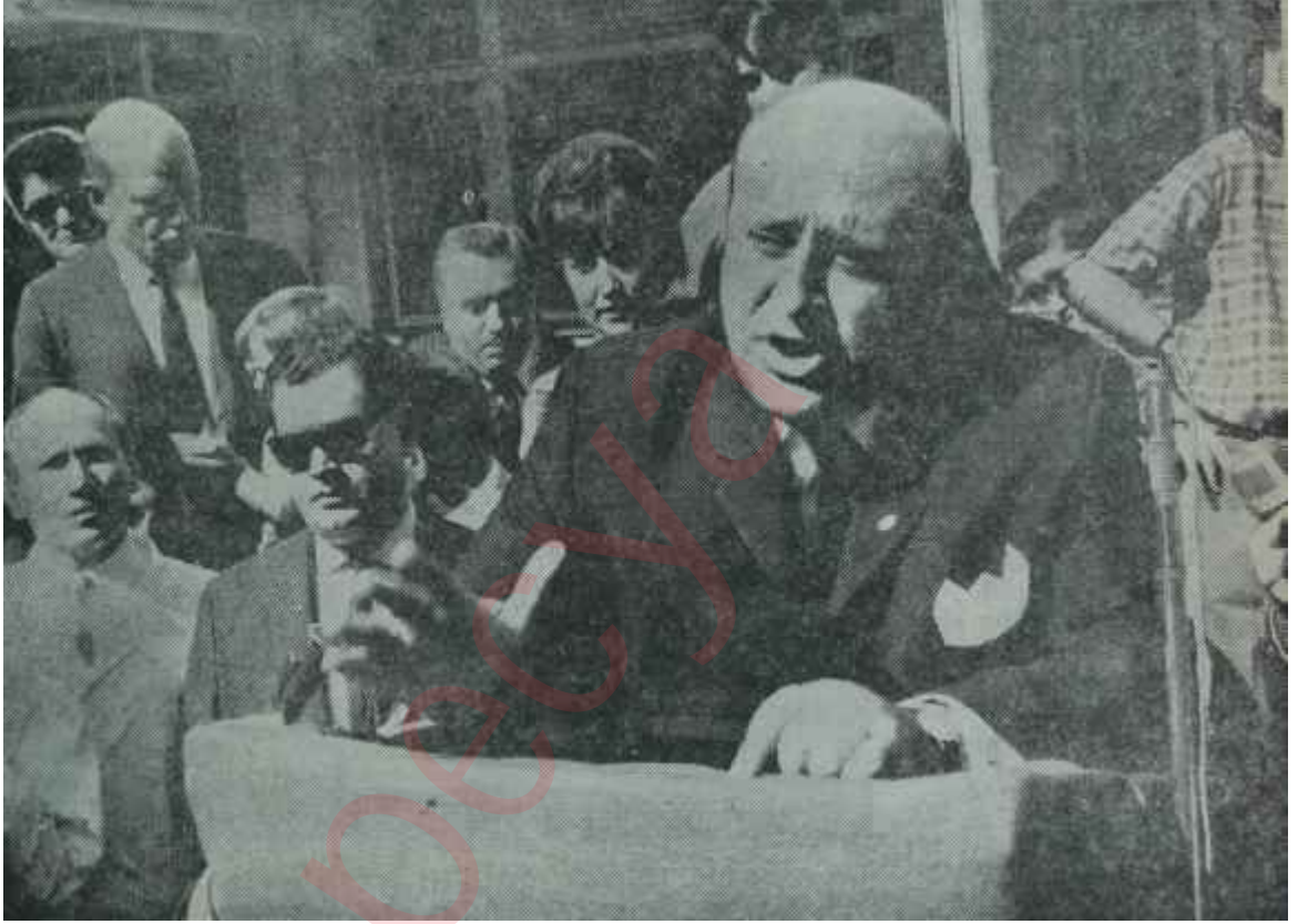
Başbakan Demirel konuşuyor Bulanık suda balık avlıyor