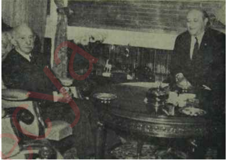
İsmet İnönü ve Süleyman Demirel Tefsirsiz bir sohbet

Sonra, dış politika konularına atlandı.. Başbakan, önce kendisi bilgi veriyordu. Fakat Dışişleri Bakanımı çağırıp bilgiyi ona verdirtmeyi daha doğru buldu. Çağlayangil