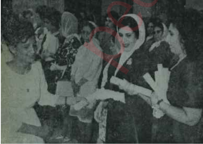
Ürdünün gerçek kraliçesi Zeyn diploma veriyor ...ama oğlu "anasının kuzusu" değil

Kral Hüseyin, 1956'nın ilkbaharında işte bu Glupp Paşanın eline çantasını veriyor, kendi özel otomobiliyle son sürat hava alanına gönderiyor ve İngiltereye geri yolluyor. 1955 karışıklıklarından sadece dört ay sonra.. Bu, Hüseyinin ikinci büyük imtihanıdır. Düşünmek lâzımdır ki bunu yaparken Ürdün, Bütçesini denk getirmek için İngilterenin eline bakmaktadır. Hüseyinin hareketi bütün Ürdünü bayram sevincine gark ediyor. Genç arap subayları işe tahtta ciddi bir kralın bulunduğunu anlamışlardır.