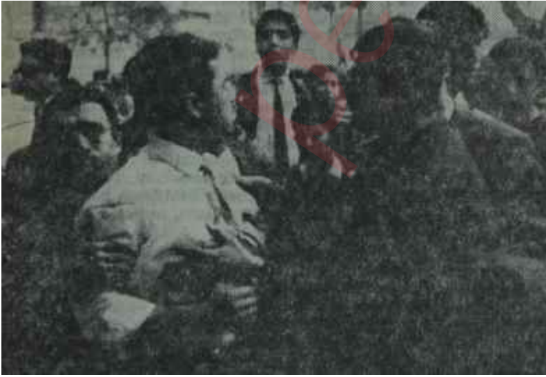
Kızılayda gençlerin çatışması İdarenin idaresizliği

Nitekim geçtiğimiz haftanın to- nunda Cumartesi günü yürüyüş Tandoğan meydanında başladığın- da, katılanların sayısı 500'ü bulmu- yordu. Fakat polisin bilinen tutu- mu, amerikalılara ve özellikle aşırı amerikan dostu AP Hükümetine kızan üniversite gençliğinin iltiha- kı ile, Kurtuluş alanında 34 bin ki- şilik bir kalabalık toplandı. Hele, kendilerine gazeteci süsü veren po- lislerin kalabalık arasında suçlu tesbitine kalkmaları ve sonraki ge- lişmeler, geç saatlere doğru işin ma- hiyetini değiştirdi. Artık tepki yal- nız amerikalılara karşı değil, kendi- sinden o saatlerde "Morison Süley- man, yolculuk ne zaman?" diye söz