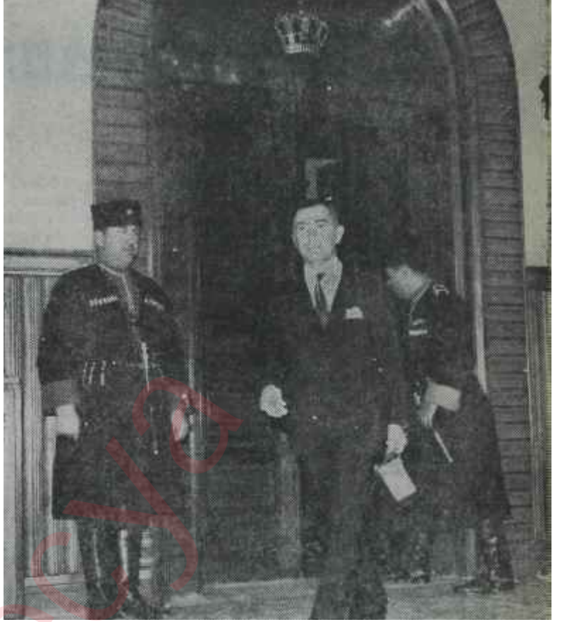
Toker Kralın odasından çıkıyor Orta Doğu meselelerine bir ışık

Bir de, anlaşılımsız batılı dostlar vardır. İhtilâlcî sosyalizmin kazanmadığı zaferi Orta Doğuda Kralların kazanması, şüphesiz, batılı politikanın bir galibiyeti olacaktır. Krallık müessesesi anakroniktir ama, Orta Doğu bölgesinin yaşadığı hayat daha da anakroniktir ve buradaki kralların kendilerini zamana ve şartlarına uydurmaları topluluklara nazaran, hattâ politikacılar nazaran daha çabuk olmaktadır. Meselâ İranda Şah ve Ürdünde Hüseyin, idare ettikleri memleketlerin