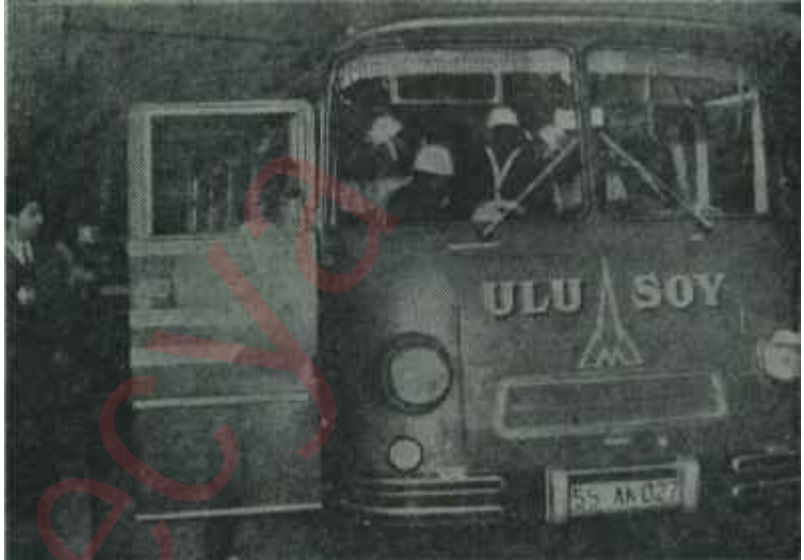
Ulusoy otobüsleri polisin emrinde