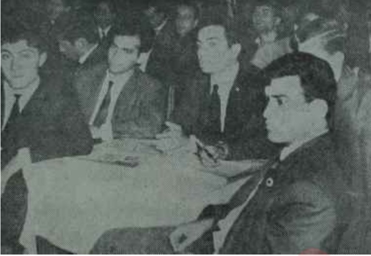
TMTF Kongresinde ilk gün Savaş kuliste yapılıyor

yorlardır. Sakarya AP İl Başkanlığı binası, Milliyetçi Öğretmenler Derneği merkezi ve şehrin en iyi otellerinden Dilmenin geniş salonu, ilk ve müteakip geceler kulislere sahne oldu.