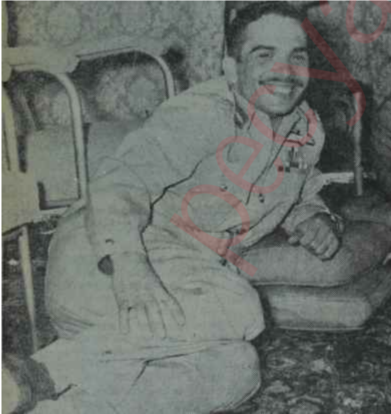
Kral Hüseyin dinleniyor Hak edilmiş istirahat

Orta Doğuda yeni bir ekip meydana çıkmış ve vaktiyle Nasırın oynadığı rol kadar aktif bir vaziyet almıştır. Buna, "Krallar Ekibi" adını vermek hata değildir. Zengin Suudî Arabistan Kralının birinci plânı işgal ettiği bu ekip, ihtilâci sosyalizmin başaramadığını "tekâmül yoluyla kalkınma" prensibinin başaraacağı inancını yaymaya çalışmaktadır. Ancak bu yeni yolun yolcularının da başlıca iki büyük handikapı vardır. Bir defa, krallık müessesesi, bazı yerlerinde henüz orta çağ yaşanmakta olan Orta Doğunun arap âleminin bile çok çevresinde ziyadesiyle anakronik bulunmaktadı. İkincisi, bu ekibin arkasından da büyük petrol şirketlerinin menfaatinin olduğu hiç kimse nin gözünden kaçmamaktadır. Faysal, en fazla bu handikapları boyamak için elinde "İslâm tesanüdü" bayrağıyla ortaya çıkmıştır ama, şimdiye kadarki kampanyasının iki kralın, Kral Hüseyinin ve Şahın platonik desteklerinden daha fazlasını sağlamamış bulunduğu ortadadır. Türkiye ile Pakistan buna hiç ilgi göstermemişler, dini özellikleri olan Lübnan bunu üstüne alınmamış, Kuzey Afrikanın arapları kendi aralarında haşır neşir olmayı tercih etmişlerdir. Nasırın idaresindeki kuvvetlerse, Mısır'da, Suriyede ve Irak'ta bunun "Faysalın bir oyunu" olduğunu bildirerek karşısında açık vaziyet almışlardır. Böylece "İslâm tesanüdü" arapları birleştirecek yerde yeni bir ayrılık vasıtası olmuştur. Gerçi Faysal, İslâm