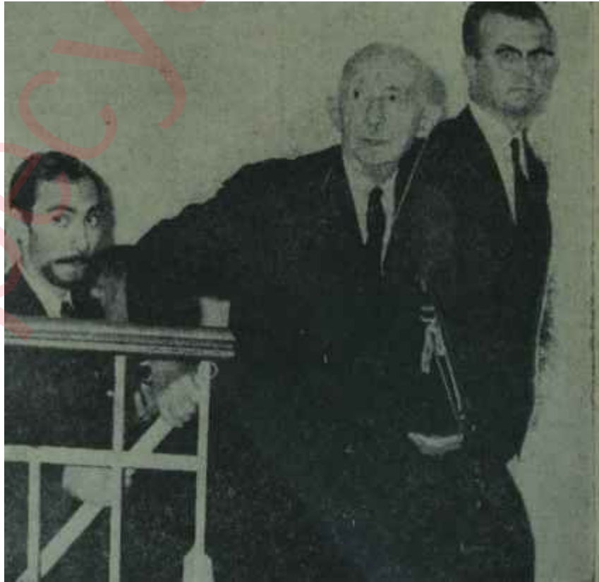
Genel Başkan İnönü Genel Merkeze geliyor Yeni ekiple, yeni savaşırlara

CHP'nin yeni yöneticilerinin, Kurultay mücadelesinden doğan hissi davranışları ve öfke sonucu olayları tahammül ile karşılamaları doğru, fakat "çelme" istememeleri de mantıktır.