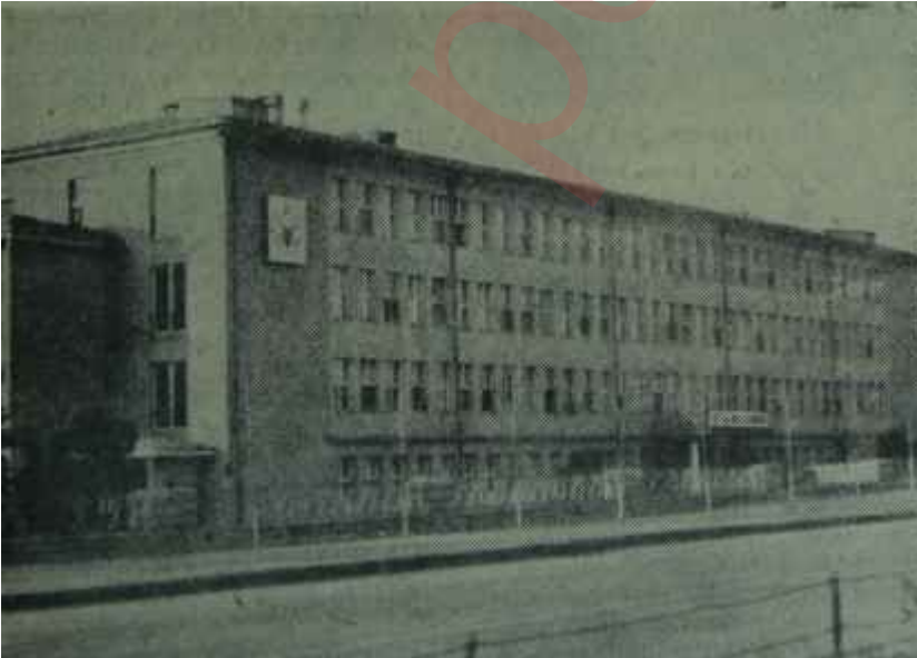
Et ve Balık Kurumu Genel Müdürlüğü