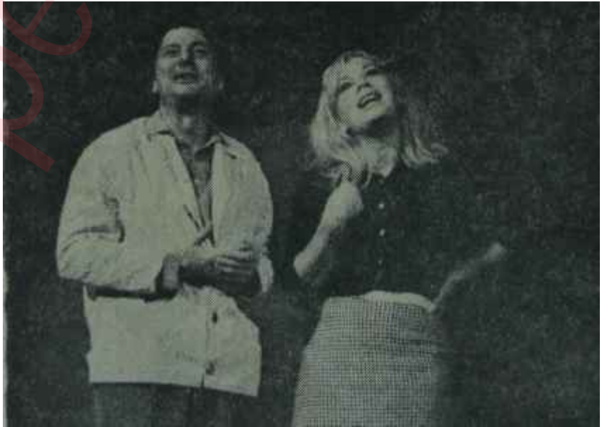
Küçük Tiyatrodaki "Kırlangıçlar"