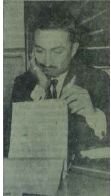
Ecevit, Genel Sekreter seçilmeden önce ve sonra Ayağının tozuyla işbaşına