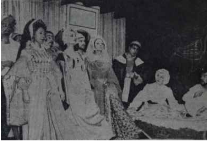
Oraloğlu Tiyatrosunda "Kralın Kısrağı" Yarışı kazandı...

Oyun : "Kralın Kısrağı" ("La Juraent du Roi"); komedi, 3 perde.