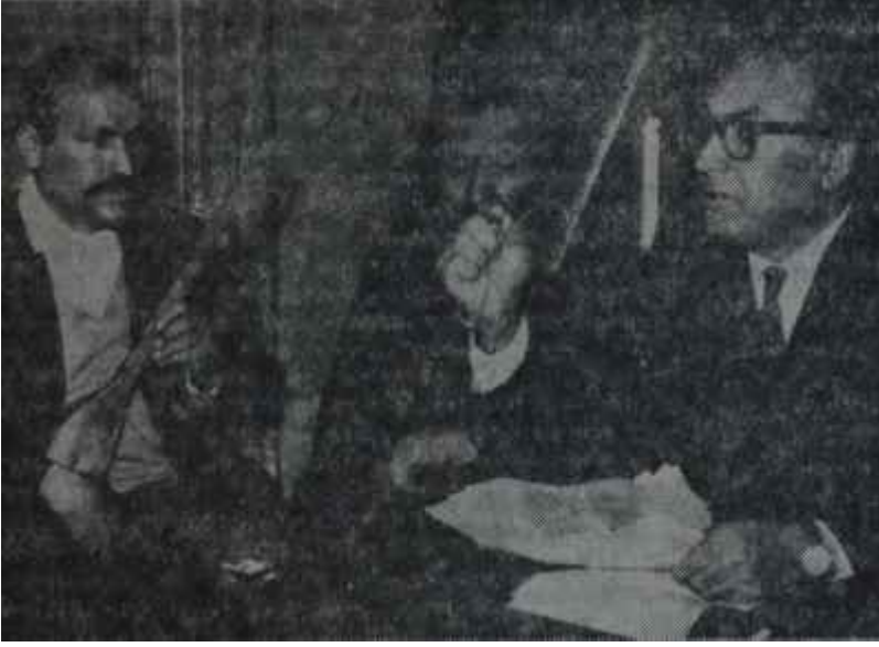
Saz şairleri ve Yaşar Kemal basın toplantısında AP'nin boy hedefleri

kümetin bahsettiği komünist şebekesinin bir mensubu ve ortaya çıkan bir ipucu idiye?..