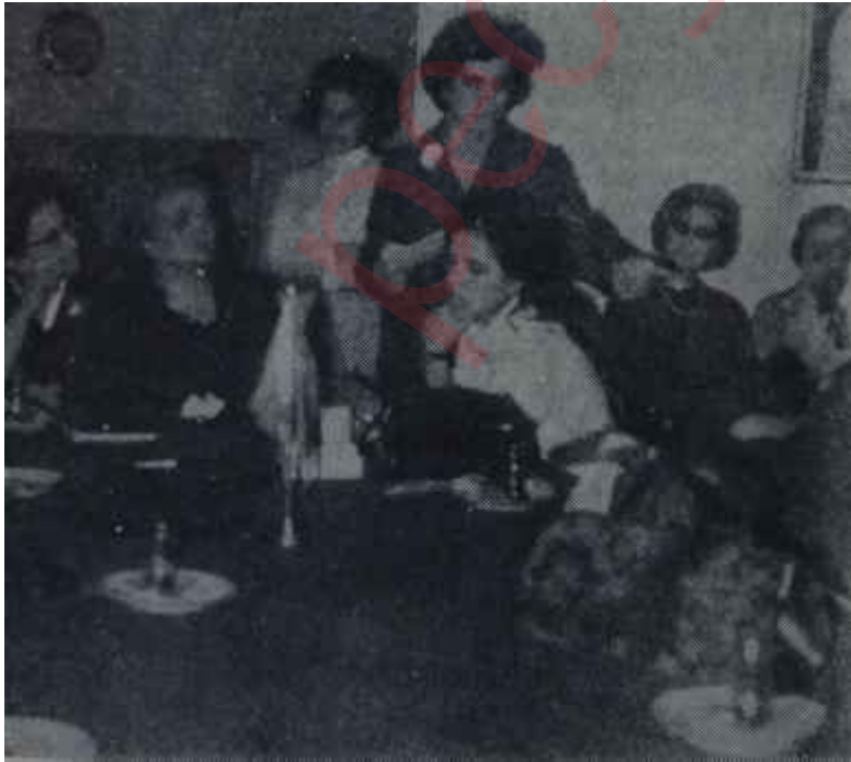
Üniversiteli Kadınlar okuma - yazma kampanyasında, Gayret kadınlara düştü!

Gürselin sağlık durumu yüzünden balolar, yemekler durmadan er-