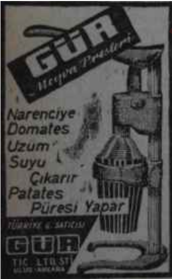
(AKİS - 72)