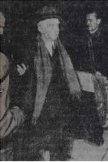
İsmet İnönü - Süleyman Demirel Eski camlar bardak oldu

bakandan bir randevu talep etmiş, gitmiş, bilhassa af ve seçim kanunlarının getirilmesi ve memleketin umumî durumu hakkında görüşlerini hulûs ile bildirmişti. İsmet İnönünün Demirele söylediği, havanın elektrikli ve gergin bulunduğu, tansiyonu büsbütün' arttıracak davranışlardan sakınılması, meselâ bu iki netameli tasarının hiç olmazsa iki ay geciktirilmesi idi. Fakat Demirel bu ikazın sebebini de, mânasını da, mahiyetini de hiç anlamamıştı ve üstelik, partilerarası gerginliği şahsen arttırmak ister gibi Grubunda tahrirlerde, beyanlarda bulunmuştu.