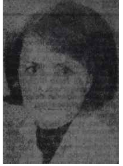
Adalet Ağaoğlu Sanatçı açısından