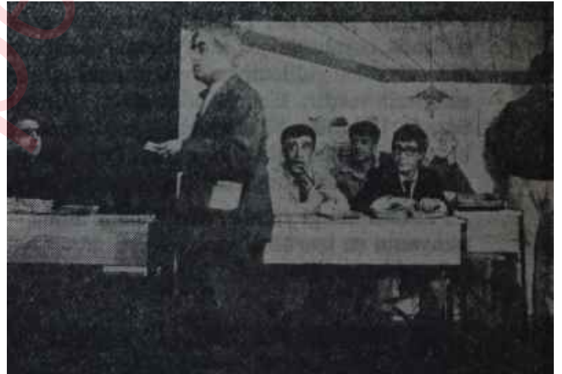
Küçük Sahnede "Hababam Sınıfı" Hababam makamlarının adayları