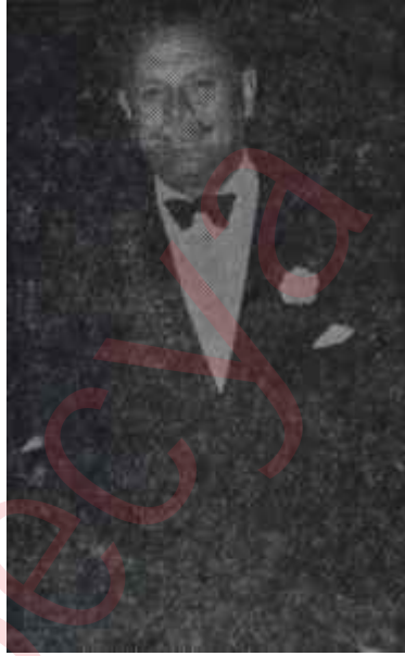
Eyüp Han imzadaki keramet

Fakat birkaç yıldır köprülerin altından akan sular, bir zamanlar "olmaz" diye düşünülenleri oldurmuş ve Hindistan ile Pakistan, Batı dünyasına ne kadar yalan bağ-