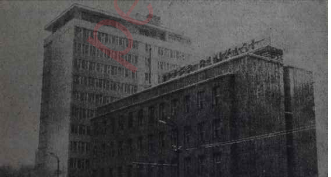
İller Bankası Genel Müdürlüğü binası

Mesele, Balıkesire bir hastahane inşa edilmesi ile ilgilidir. 1948 yılında bu hastahanenin inşası için İller Bankası 1 milyon 935 bin lira kredi açmayı kabul etmiş ve bununla il-