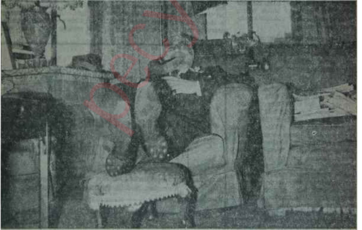
Gülbenkyan koltuğunda en keyifli pozunda "..yak çubuğunu, keyfini ara!"

"— Kraliçeye, senelerce evvel aldığım dersi hâlâ unutmadım. Kim ne yaparsa yapsın, ben Majeste, huzurunuzda daima beyaz eldivenlerimle çıkarım, dedim" diyerek güldü.