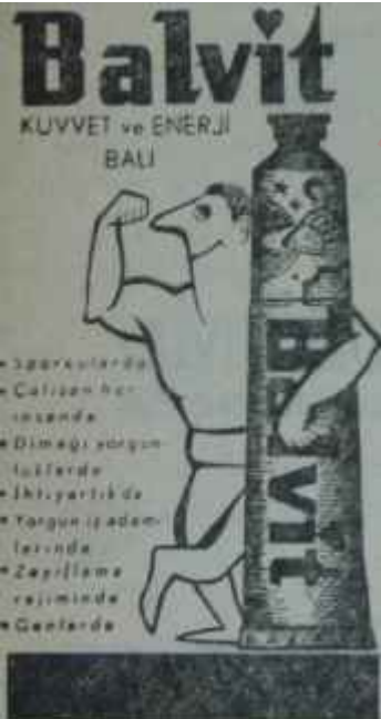
(AKİS — 680)

Eğer Şelepini görevindeki değişiklik, bu genç adamın ileriye doğru gitmesi demekse, o zaman Kreminde olup bitenleri hep bu açıdan değerlendirmek gerekir. Unutulmalıdır ki, yaşlı Mikoyanın emekliliği, yumuşak yüzlü Podgorninin ikinci plâna atılması, sertlik taraftarı Şelepini yer değiştirmesi, tam, Sovyet savunma giderlerinde yüzde 5 oranında bir arttırma yapıldığı günlere rastlamaktadır. Bu değişikliklerden birkaç gün önce, Sovyet yöneticilerinin konuşma tonu da birdenbire sertleşmiştir. Bütün bunlar, bir İngiliz gazetecisinin de dediği gibi, önümüzdeki kışın oldukça sıcak geçeceğini gösteren belirtilerdir.