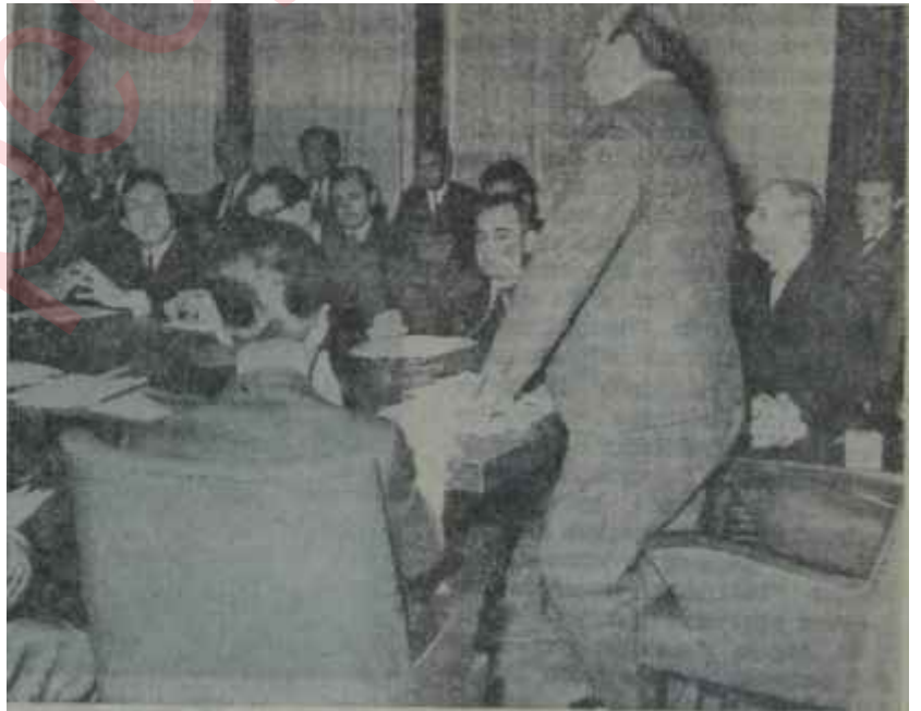
Başbakan Demirel özel sektör önünde Faturaları şimdi kim Ödeyecek?

Ancak, Türkiye Cumhuriyeti Anayasasının 2. maddesi, AP İktidarının hummalı çalışması arasında herhalde gözden kaçmış olsa gerektir!..