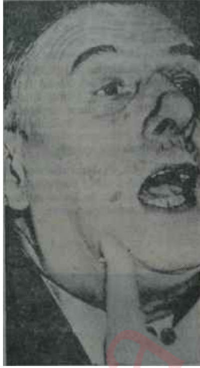
General De Gaulle "Ya devlet başa."

Seçimlerden önce yapılan kamuoyu yoklamaları, De Gaulle'ün oyların yüzde 50'sinin altına düşmesi ihtimalini hemen hemen yok denecek kadar az gösteriyorlardı. O kadar ki, De Gaulle'ün en koyu muarızları bile, eğer General oyların yüzde 51'ini alırsa, bunun muhalefet için büyük bir başarı olacağını düşünmüşlerdir. Fakat, çoğunlukla olduğu gibi, bu Pazar akşamı Fransadaki seçim sandıklarından çıkan oylar, kamuoyu yoklamaclarım ve siyasal yorumcuları bir kere daha yalancı çıkarmıştır. Seçime katılma oranı