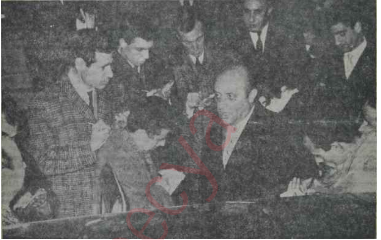
Süleyman Demirel Genel Kurmaydaki toplantıdan çıkıyor.