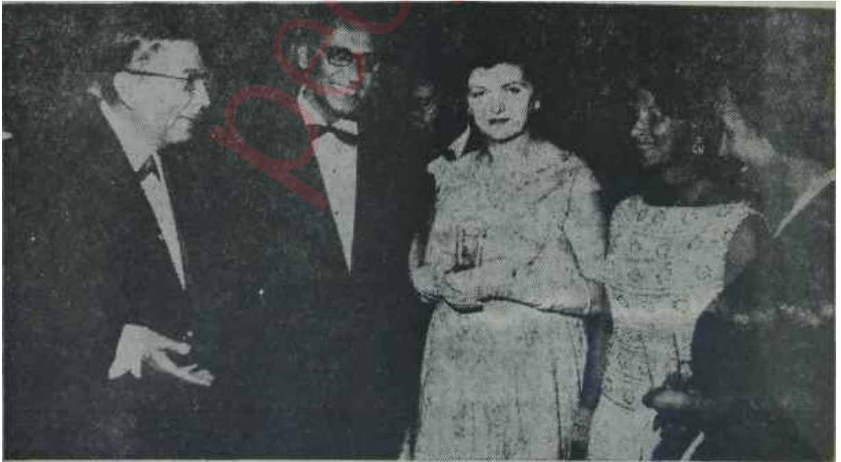
İran Şahının doğum yıldönümü kokteylinde Bozbeyle ve Çağlayangil Göl maya tutunca...