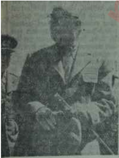
Celâl Bayar Bit kanlanınca.

1965 Seçimlerinin "Büyük Galip"i Süleyman Demirele, kendilerini bu seçimlerin "Gerçek Galip"i bilenlerden ilk faturalar bu hafta gelmeye başladı. İlk faturanın, belki