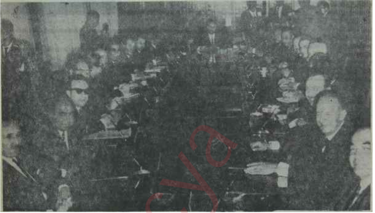
Demirel Kabinesi toplu halde Seç seç al!.. - Derya kuzusu bunlar!..