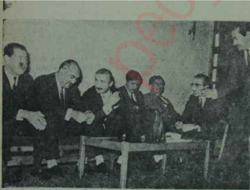
Mecliste AP Grupundan önce AP'liler kuliste 1955'in DP Grubu da böyleydi