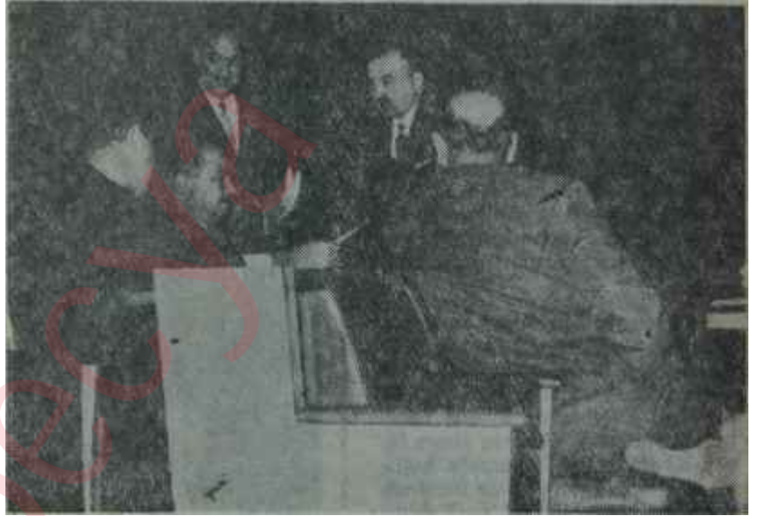
AP'de Bilgiççiler faaliyette Yaya kalan tatar ağaları

Demirel, bu kabinesinin programını haftanın başındaki Salı günü kendi partisinin Meclis Grubunda okudu. Fakat bu, hikâyenin başı değil sonu oldu. Hikâye, asıl, altı gün önce başladı.