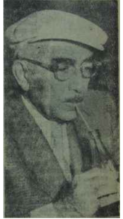
Yakup Kadri Karaosmanoğlu Patlıcanın hizmetinde

"Büyük Edip", rahatlayacak yerde daha fazla sıkılıyor gibiydi. Biraz sıhhatinden bahsetti. Ciğerleri gene iyi değildi. Çok çabuk bronşit