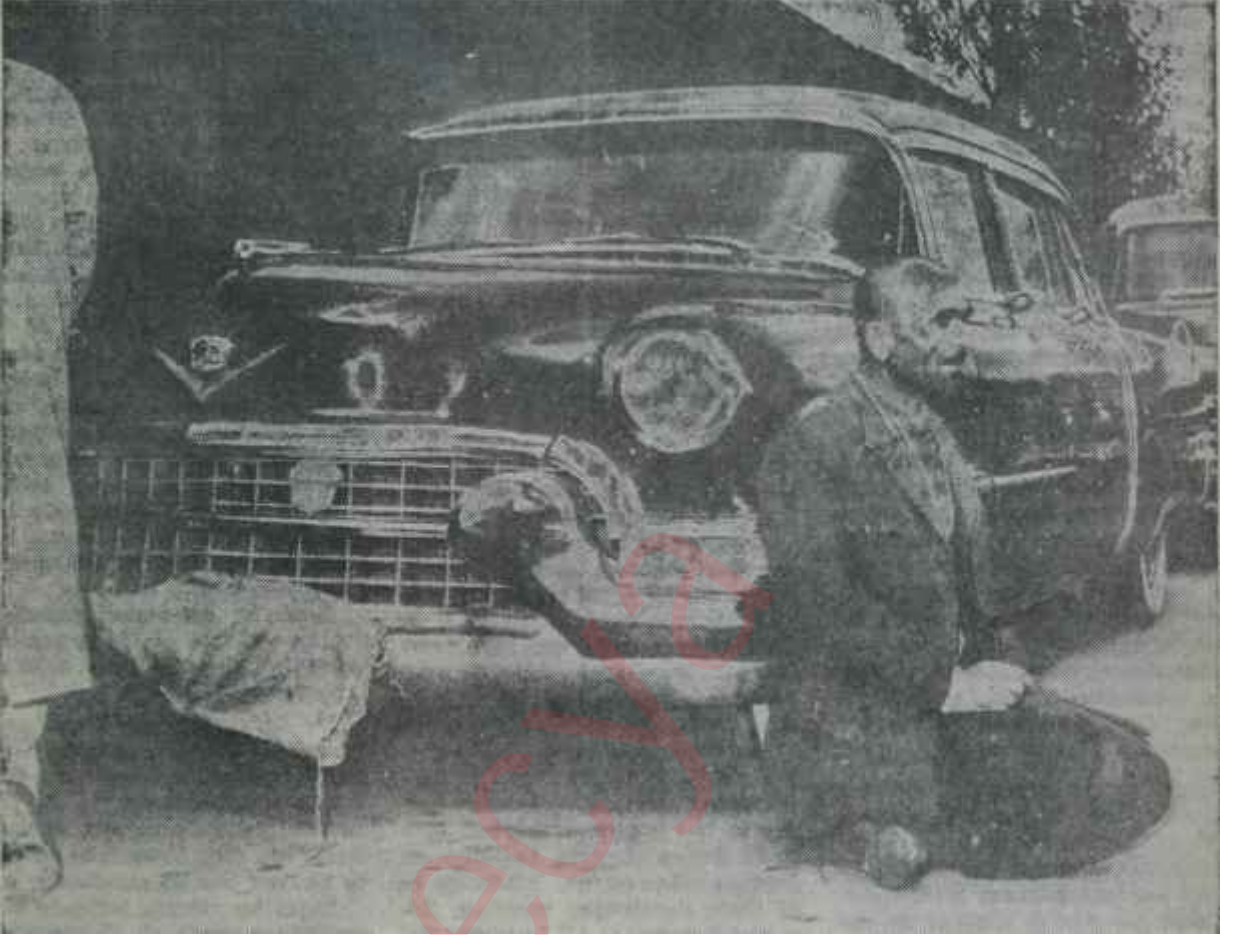
Bu Cadillac'ın sahibi de, önündeki dilenci de aynı partiye, AP'ye oy vermişlerdir.