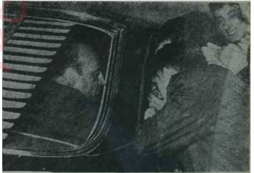
Demirel Çankayadan dönüyor

Başka bir prensip, kabinede bütün mesleklerin temsili idi. Demirele göre