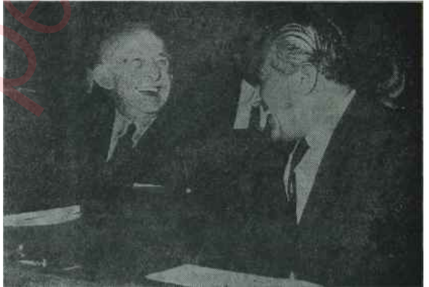
CHP lideri İnönü Mecliste Sel gider, kum kalır

"— Grup Yönetim Kurulu secimi, Partinin politikası bakımından son de-