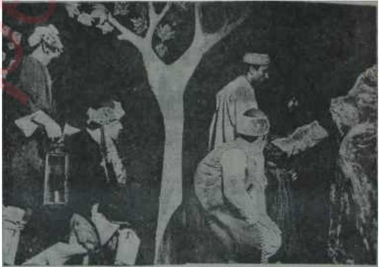
"Ferhâd ile Şirin"