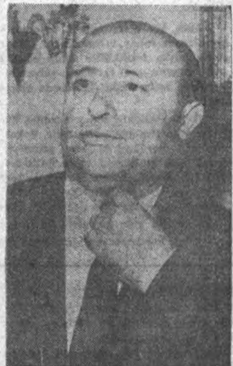
Süleyman Demirel seçimleri izlerken