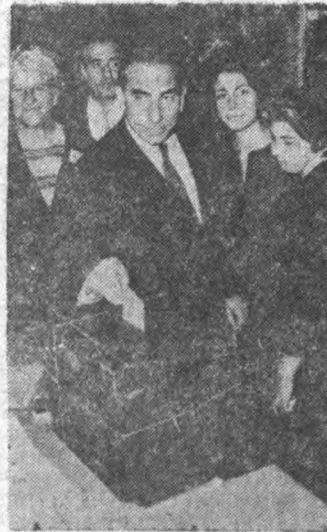
Alpaslan Türkeş Yel üftürdi, su götürdü