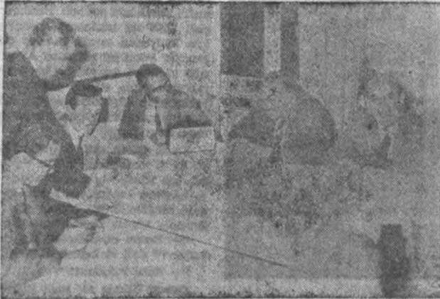
AP'de Bilgiç grubu seçimi izliyor

Sükanın partiliye vaadettiği para ya şahsî borcuymdu, ya da parti işlerinde kullanılmak üzere Uşaga gönderilecek paraydı!