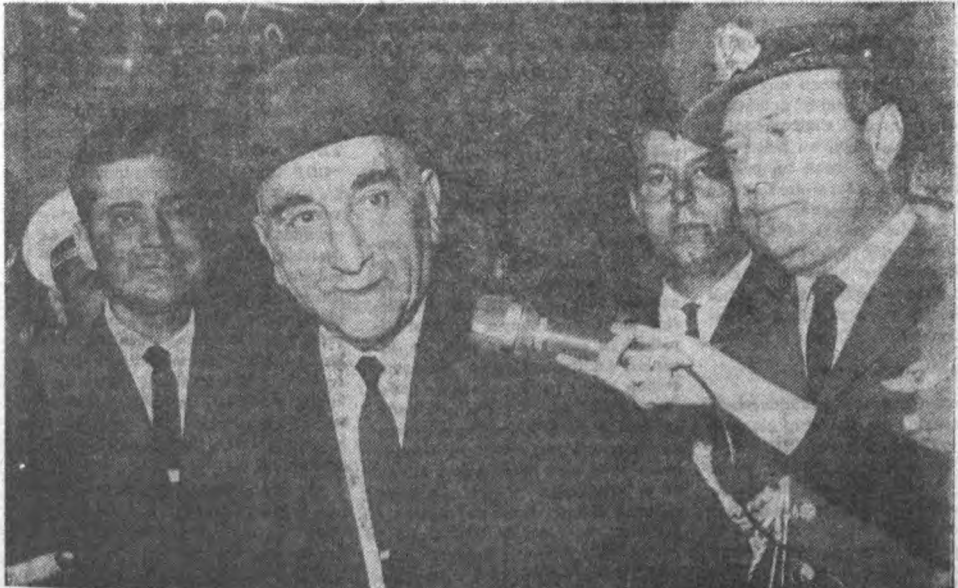
Cemal Gürsel konuşuyor Sorumluluğun faziletini

Gerçek şudur ki Çankayada bir çevre, "İdeal İktidar" olarak; içinde sureti katlyede İsmet İnönü bulunmayan, gene bir tarafsızın -tercihan Suat Hayri Ürgüplünün- başkanlığında, iskeleti AP olan bir koalisyonu görmüştür. Bunun gerçekleşmesi için de elinden geleni yapmıştır. Böyle bir koalisyonun, gene Çankayanın tesiri altın da bulunacağı ümidi, bu gayenin gerçekleşmesinin çalışılmasının sebebini teşkil etmiştir. Gerçekten de bizzat Cemal Gürsel, herkesin yanında dahi "Süleyman" diye hitap ettiği AP Genel Başkanının uysallığından hep memnun kalmıştır. Ama kendisini o yolda asıl teşvik eden, dışardan hükü-