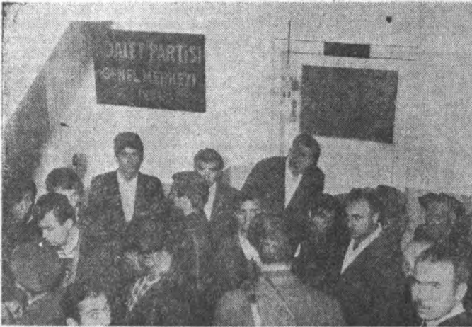
AP'liler seçimleri izliyorlar

Birincisine memleket idaresi mi öğretiriz, ikinciyi seçim kazanma dersi mi veriz, ne yapacaksa bir an önce yapsak pek iyi olacak. Yoksa bu tahtura'vî oyununda onlardan biri değil de tüm memleket içüstüne bir oturacak, bir daha kaldırılabile-ne aşkolsun..