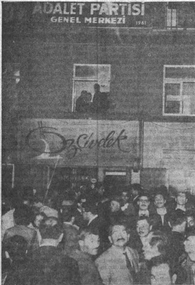
AP Genel Merkezi önünde bekleyen AP'liler Şenlik var

AP'de müstakbel Bakan olarak Mithat Dülgeden dahi bahsedilmektedir ki, bu, nasıl bir cümbüş hazırladığını göstermektedir.