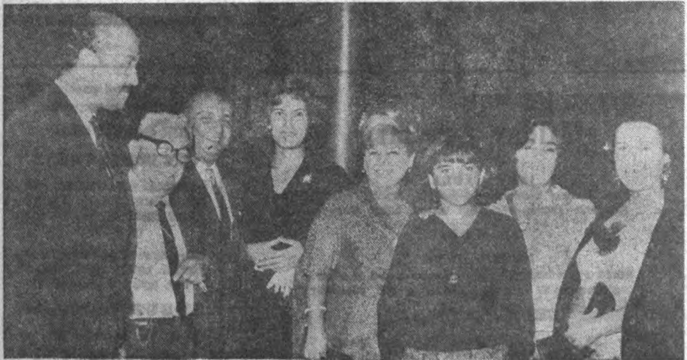
Operanın açılışında Operacıardan bazıları Sanatçılardan bir demet

Devlet Operasında yıllarca bir defa bile sahneye çıkmadan maaslarını alan, sonra da durmadan yöneticilerden şikâyet eden sanatkârlar, Aydın Gün geldikten sonra dut yemliş bülbü-