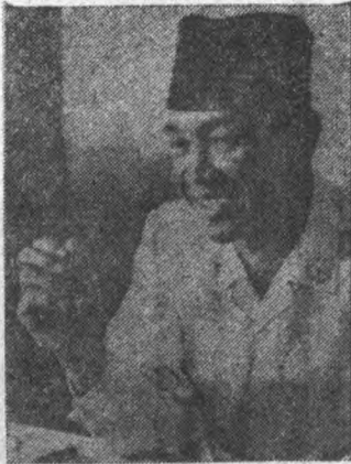
Sukarno Başı derdele

Aden bölgesinde İngiltereyi en çok uğraştıran bütün ekonomik varlığını İngiliz vergi mükelleflerinin ödediği paralarla borçlu olan şeyhlikler değil, gemiler için her türlü işlem kolaylıklarına sahip modern limanıyla, petrol rafinerileriyle, kendi kendine yeten bir ekonomik ünite olan, Aden Kolonisi limanları, bu limanın kendi topraklarının bir parçası olduğunu ileri sürerek, İngiltereye rahat vermemişlerdir. Hele Yemen'de Cumhuriyet rejiminin kurulmasından sonra, İngiltere için Adende tutunmak daha da zorlaşmıştır. Gerçi Aden halkı kaynak bakımından çok karışıktır ama, Adenli araplarda çok uyanık bir milliyetçilik şuuru geliş-