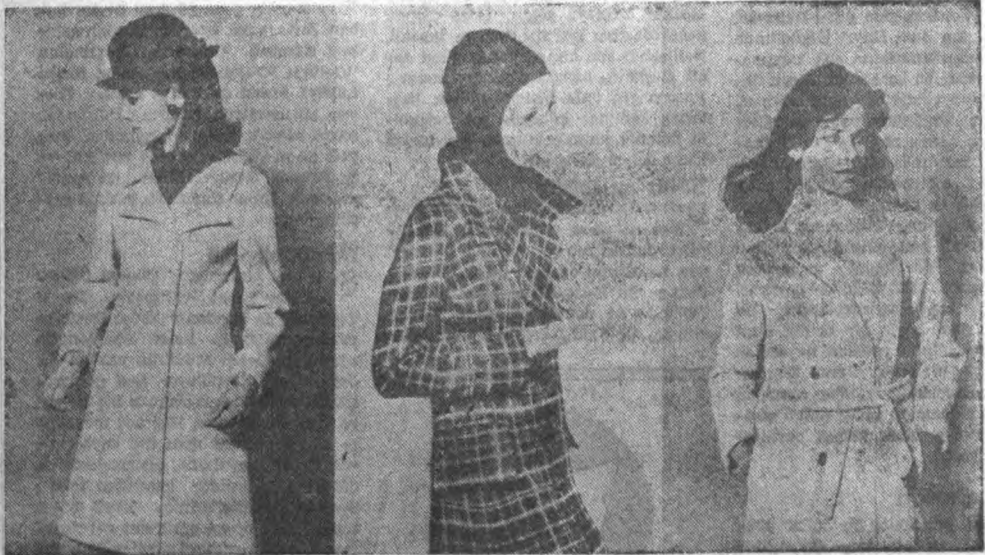
Yılın modası mantolar

Çok fazla modern, çıplak eşyalar-la döşenmiş bir oda ise birçok kim-selere soğuk şekilde tesir etmekte, evi gereken sıcaklığı, samimi havayı ve rememektedir. Bunun içindir ki mo-dern dekorasyonda, eskinin ve yeninin zevkli bir şekilde karıştırılması, bugün artık doğrudan doğruya moda haline gelmiştir. Meselâ bir salonda rahat modern, aynı zamanda gerektiğinde yatak yazifesini gören bir büyük ke-nape vardır. Fakat bunları tamamlayan iki koltuk XVI. Louis stilinde olup, odada büyük bir değişiklik, başka bir hava meydana getirmektedir. Modern kanapeye uygun çok modern bir puf, kanapenin üzerine yere yakın şekli-de uzanan çok modern iki lâmba ve düz renk modern bir halı odanın yeni tarafını tamamlarken, eski ve yeni bit-lolarla süslenmiş bir büyük gömme e-tajer, odada bu iki cereyanı birbirine karıştırmaktadır. Etajerde çok modern, seramik duvar tabakları, eski zaman-da kalma güzel bir mücevher kutu-su, birkaç gümüş parça, bol miktarda modern kapaklı kitap, asılı olarak duran bir maske vardır. Eski zaman koltuklarının önünde duran masa ise modern bir masadır. Duvar dekoras-yonuna gelince, duvarlar, stülize edilmiş eski motiflerle süslenmiştir.