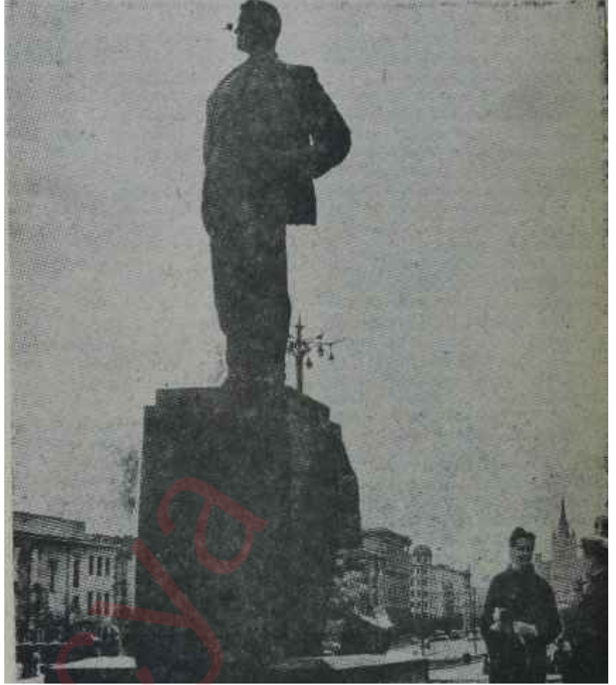
Moskova sokaklarında bir gezinti

Lokantalarda her çeşit halkın bulunmasının ikinci sebebi, Sovyetler Birliğinde gerçekten sınıf farkının olmaması. Şimdi "sınıf yok" derken herkes aynıdır diye düşünmemek lâzım. Yapılan işler tabii ki sınıf sınıf. İdarecisi var, idare edeni var, mühendisi var, işçisi var, sanatkârı var, memuru var. Ama, zengini ve fakiri sahiden yok. Yani, bir belirli ölçüden fazla varlığı bulunan yok, bir belirli ölçüden az -eğer çalışıyorsa- varlığı bulunan yok. Sistem işsizliğe imkân bırakmadığından herkes çalışıyor ve herkesin yiyecek ekmeği, giyecek elbisesi ve yatacak yeri oluyor. Sisteme nazaran bugünkü sosyalist devrede herkes çalışması kadar alacağı ve emeğin değerini devlet tâyin edeceği için hiç kimse sivetini ilânihaye arttıramıyor. Serveti ilânihaye arttırabilmek için bir devridaim makinesini ihtiyaç bulunduğu aşikâr. Bu devridaim makinesi istihsal vasıtalarına sahip olmak ve kendi hesabına adam çalıştırmaktır. Bunların ikisi