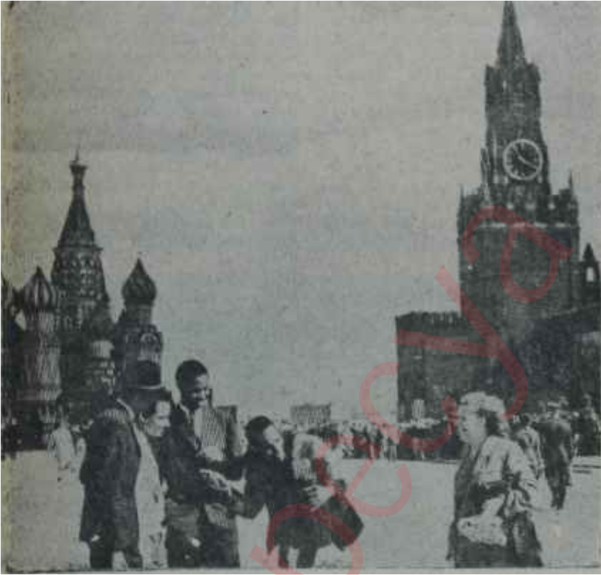
Kızıl Meydanda yerliler ve yabancılar

Öğle yemeğini geç vakit otelde, üzerinde Türk bayrağı bulunan masamızda yedik. Yemek bittiği zaman saat 16'yı geçmişti. Sovyetler Birliğinde lokantalar sabahın 11'inden akşamın 11'ine kadar açık. Kim ne zaman isterse gelip yemek yiyor. Onun için bakıyorsunuz saat 18'de veya 22.30'da akşam yemeğini başlayanlar var. Lokantaların halkı çok değişik. Bizim Sovyetkaya Otelinin bütün Sovyetler Birliğinin en büyük oteli olduğunu söylemiştim. Aşağı kattaki, yerli halka