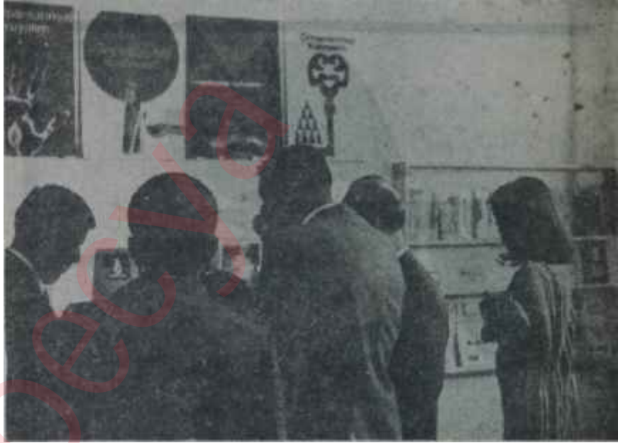
Tatbiki Güzel Sanatlar Enstitüsünün sergisi