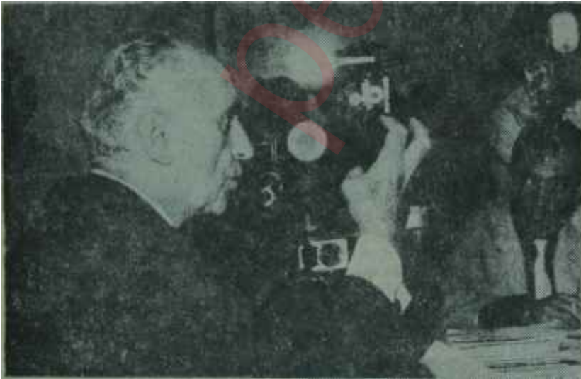
Tahtakılıç gazetecilerle konuşuyor

İkinci gün, adaylar konuştuktan sonra seçime geçildi- O sırada AKİS muhabirinin gözleri önünde şu olay