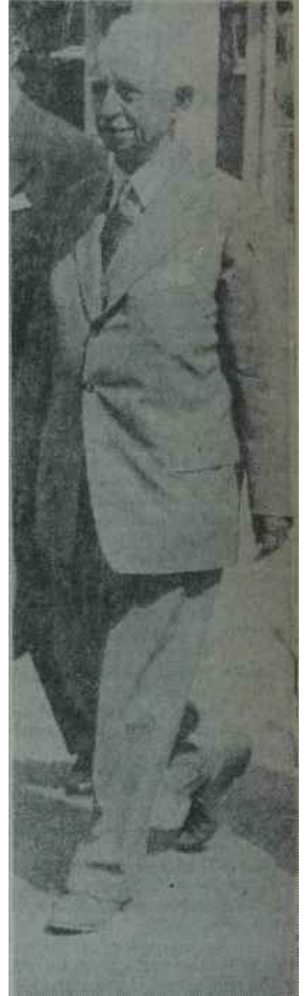
İsmet İnönü Kampanya açıldı

Gerçekten de A.P.'liler dört yıldan beri her seçimde yüzde 80 alacaklarını söylemektedirler. Seçim yapılırken yüzde 65 aldıklarını ilân etmektedirler. Tasnif sırasında gazeteleri "A.P. oyların yüzde 50'den fazlasını aldı" diye manşetler çekmektedir. Fakat resmî seçim neticeleri ilân edildiğinde A.P.'nin hiç bir zaman 5 ile başlayan