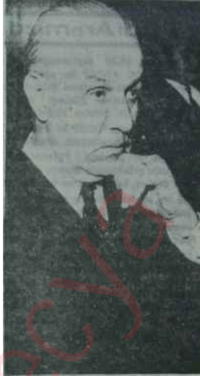
Suat Hayri Ürgüplü

Başbakan Ürgüplü Türkiyeden 9 Ağustosta, özel bir sovyet uçağıyla ayrılacak ve doğrudan Moskova gidecektir. Ürgüplü Moskovada, Sovyetler Birliği Başbakanı Kosigin tarafından karşılanacaktır. Resmî görüşmeler Moskovada cereyan edecektir. Hazırlanan programa göre Ürgüplü Kiyevi ziyaret edecek, Karadeniz sahilindeki Soçide, bir kaç gün kalacak ve Soçinin hava alanı Adlerden gene