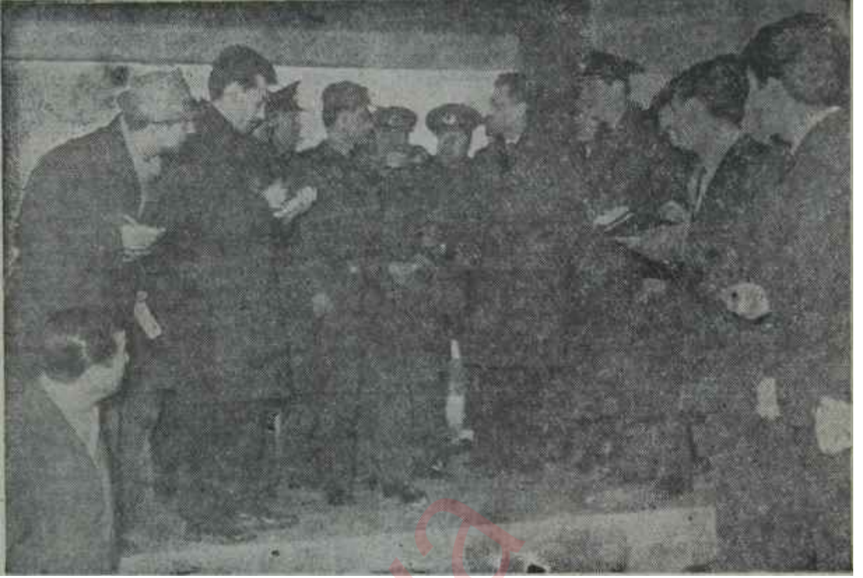
Suikasttan sonra savcı hâdise yerinde tatbikat yapıyor

suna kapiya, merdivenlerin başına seğırtti.