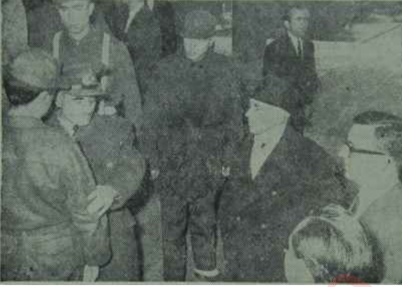
Rumen Büyük Elçisi olay mahallinde