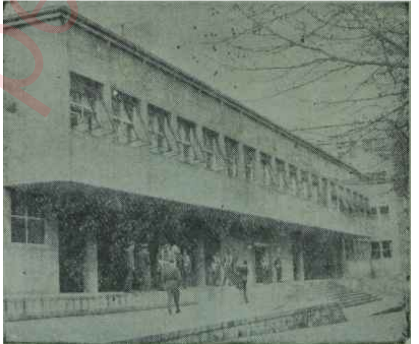
Başbakanlık binası ve nöbetçiler

Bir yandan Mesut Sunanının ilk sözleri, diğer taraftan evinde bulunan risaleler ve kitaplar en ziyade birinci ihtimâl kuvvet verdi. Üçüncü ihtimâl kısa zamanda ortadan kalktı. Komünistliğe gelince, komünist her kılığa girdiği için bir şey söylemek kolay değildir. Ama eğer bu konuda bir ko-