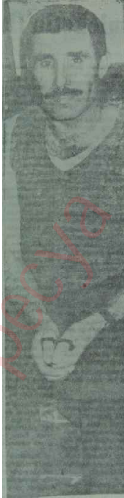
Kaatil Mesut Suna

Bir de, milletvekillerinin maaşına yapılan 100 liralık zam hikâyesi var-