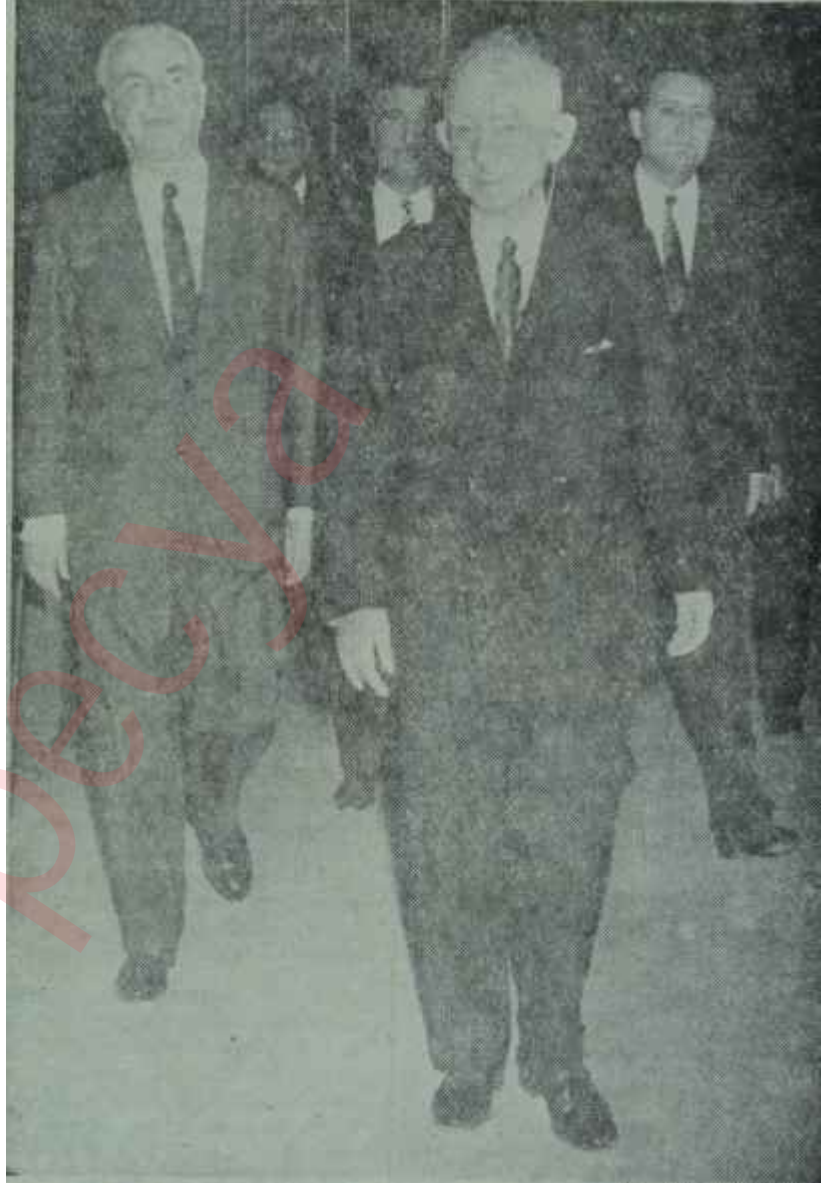
Başbakan İsmet İnönü suikast olayından sonra Mecliste