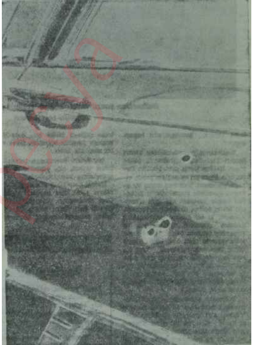
İnönü'nün Opelindeki kurşun delikleri