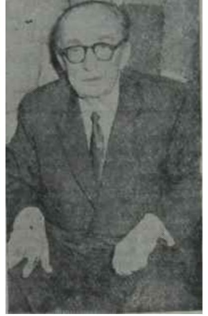
İsmet İnönü - Ragıp Gümüşpala