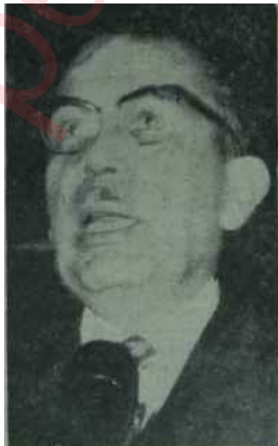
İhsan Sabri Çağlayangil Köprü