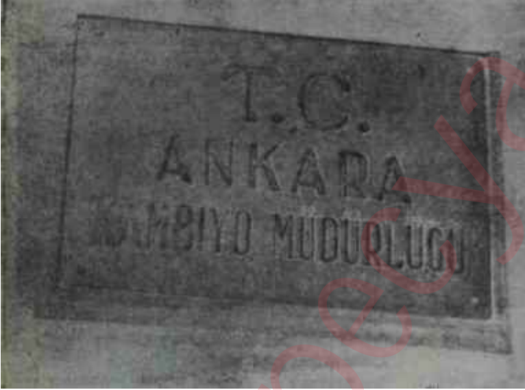
Ankara; Kambiyo, Müdürlüğü Yeni usullere doğru

Serbest malî müşavirlik müessesesi kanunlaştığı takdirde, sermaye piyasasının teşekkülünde önemli rolü olacaktır. Memleketimizde kuvvetli anonim şirketlerin yokluğunun bir sebep' de. hakem rolü oynayarak, sağlam raporlar verecek elemanların bu-