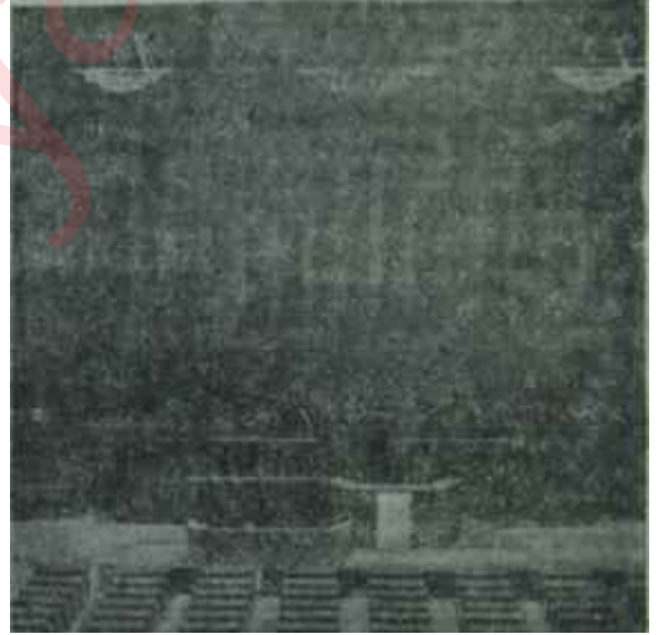
Meclis Kürsüsü Kutsal makam