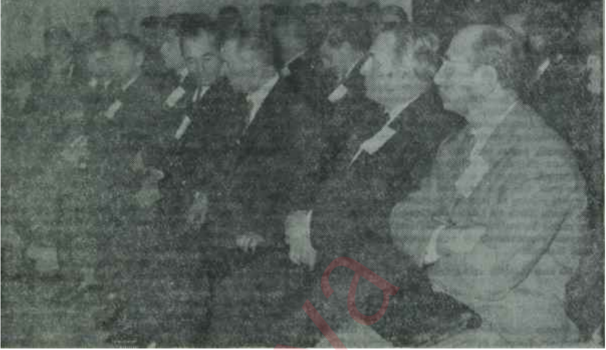
C.H.P. İl Başkanları toplantı halinde 1957 - 60'a doğru

sesi Melene intikal ettirdiler. Zaten Melenin konuşmasının büyük bir kısmı, karşılıklı soru-cevap şeklinde cereyan etti. Bütün delegeler gazyağı zammı üzerinde durdular. Bakan meseleyi açıkladı: Gaza yapılan zam evvelâ, bütçede mevcut açığa bir yama olacaktı. Sonra bir başka suiistimalin önü alınacaktı: Gazyağı fiyatlarının ucuzluğu gazın motorine karıştırılıp satılmasına yol açmaktaydı. Son zamlarla gaz fiyatlarında bir ayarlama yapılacak ve bu yolsuzluğun önü alınacaktı.