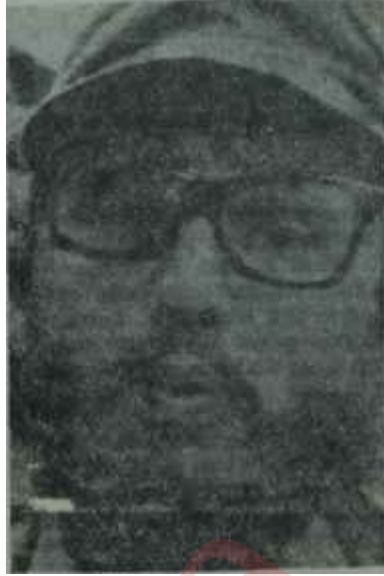
F. Castro Bir sakallı adam

Küba ile çıkan her meselede olduğu gibi, Guantanamo deniz üssünün suyunun kesilmesi de, Amerikadaki bazı hassas politikacıların ortaya yeniden abluka sözlerini çıkarmalarına yol açtı. Florida'nın Demokrat Senatörü George A. Smathers ile New