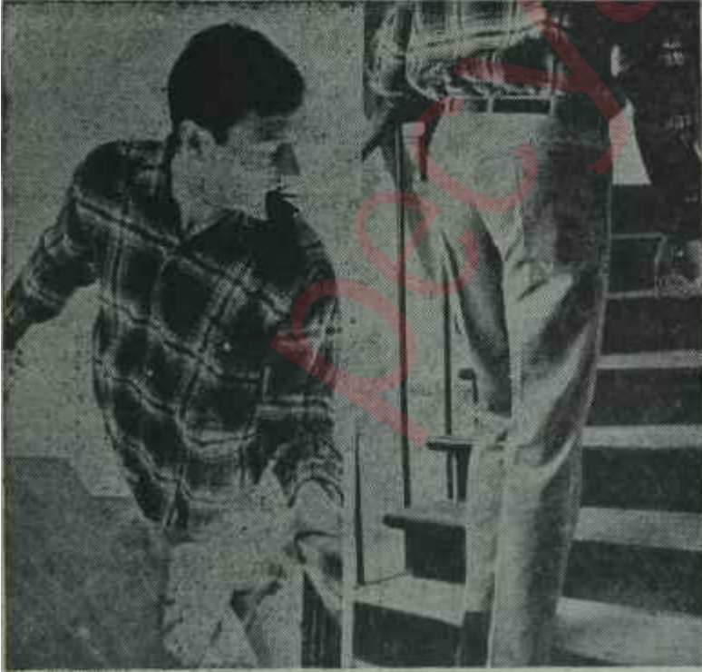
Bu yılın erkek kıyafetleri

Bu filmde genç ve yakışıklı; bir erkek, sabah kalkınca bir türlü işine gidememekte, mühim bir randevusu olduğu hâlde, hastalık bahane ederek, randevusunu iptal etmekte, bunun iptalini bile eşine yaptırmak istemektedir. Doktora giderken giyeceği kiravatı bile eşine seçtirmekte, nihayet, doktora gidince de hastalığının bedenî değil ruhi olduğu meydana çıkmaktadır. Çocukluğunda babası kendisine daima güvensizlik, annesi ise