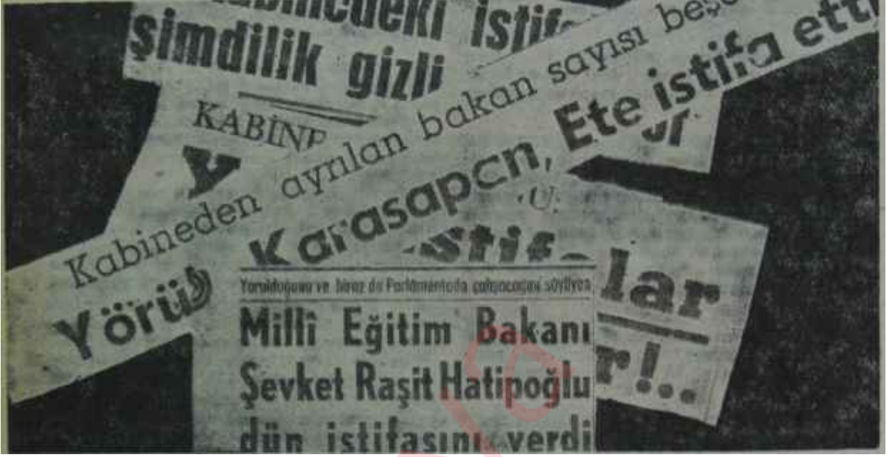
Son günlerin gazetelerindeki başlıklar Hafıza-i matbuat nısyân ile mağlûdür.