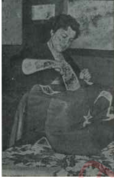
Oy kullanan seçmen Karar saati

13 Ekim günü, kimin görüşünün doğru olduğu anlaşılacaktır. Mahalli seçimlerde C.H.P. nin oy nisbeti yüzde beş artsa, hattâ yüzde dört, yüzde üç artsa iki menfi uçun yaptığı propaganda iğne yemiş balona dönecektir ve siyaset hayatımız bir anda akıl almaz sıhhat kazanacaktır.