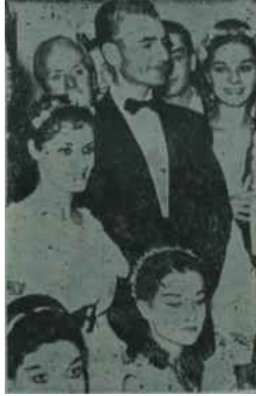
Şah M. Rıza Pehlevi Başı derte bir şah

Bu karanlık tablo karşısında Şah uzun bir bocalama devresi geçirmişti. önceleri "kimsesiz çocuklara yardım dernekleri"nde fakirlere yardım için tertiplenen balolarda kendisini avutuyordu. Fakat bu şekildeki göstermelik faaliyetler bir müddet sonra hanedanın vicdanlarını tatmine yetmedi. Bunun üzerine Şah saraya ait toprakları, topraksız köylüye dağıtmaya başladı. Aslında bu da çok ciddi bir iş sayılamazdı. Fakat Şahın