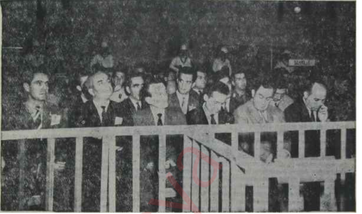
20-21 Mayıs sanıkları toplu halde Mamak Muhabere Okulunda Üçbuçuk adam!