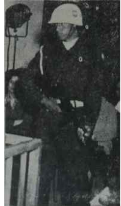
Esneyen sanık ve nöbetçisi Mehmetçik Kafaya şimdi dank etti