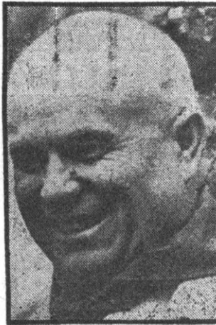
Nikita Krutçev Karıştıracak

Genel Sekreterliğe kimin getirileceği meselesine gelince, bu zat bu