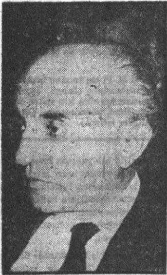
Ahmet Tahtakılıç Bir doksan bir iğit

Haftanın sonundaki o cumartesi akşamı saatlerin 18.20'yi gösterdiği sırada, Ankaranın yeni Ordu Evi binasının alt salonu Özkayaların misafirleriyle doldu. Gecenin şeref misafiri Devlet ve Hükümet Başkanı Orgeneral Cemal Gürsel . Gürsel, kokteyle en erken gelen misafir oldu. Salonun şeref köşesinde kendisine ayrılan koltuğa oturdu ve doktorunun müsaadesini alarak viskisini yudumladı. Bir müddet sonra genç evliler Başkanın yanına geldiler ve Özkaya kumandanının elini öptü, eşi ise, Gürselin nazik tebrikine mütebessim bir eda ile mukabele etti. Gecenin diğer davetlileri M.B.K. nun tam kadro halinde gelmiş bulunan üyeleri idi. İntilâlciler, Tuğgeneral Mucip Ataklı hariç, sıvî giyinmişlerdi.