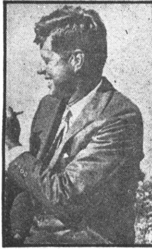
John Kennedy Yeni meseleler

Genel Sekreterin muavinlerine daha geniş yetki verilmesi, bunların kararlara daha yakından iştirak ettirilmesi fikri Birleşmiş-Milletler Genel Kurulunda gelişir ve öte yandan Sovyet teklifinin pek az memleketi tatmin ettiği meydana çıkarken, Sovyetlerin tutumunda da tabiatle bir gelişme oldu ve Sovyetler Troykayı çözdüler. Yeni Sovyetler tasarısında geçici ve fakat tabiki mümkün bir teklif ileri sürülüyordu: Genel Sekreter ve 3 yardımcısı... Gerçi bu da Batılılar tarafından tatminkar görülmedi. Fakat bir yandan teklifin geçici bir mahiyet arzemesi, diğer yandan veto hakkının kaldırılması olma-