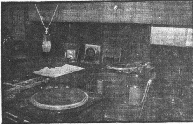
Radyoevinde 4 numaralı stüdyo Pandoranın kutusu