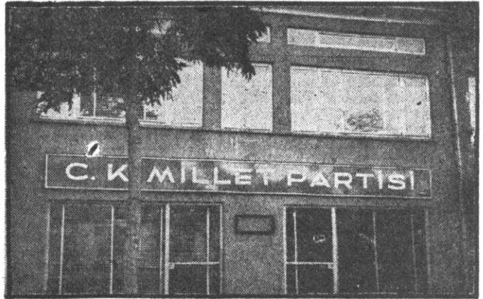
C.K.M.P. Genel Merkezi