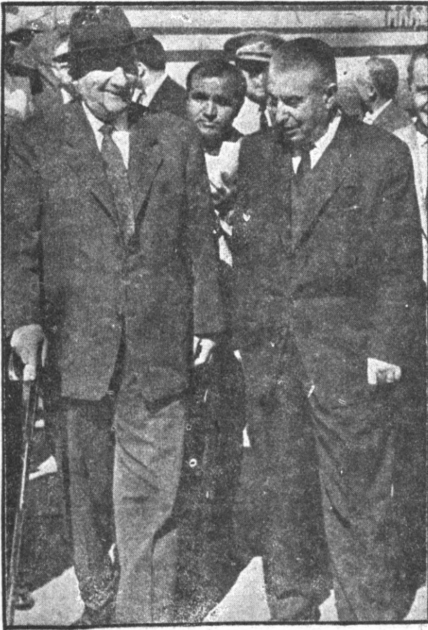
Gürsel Esenboğa Hava Alanında