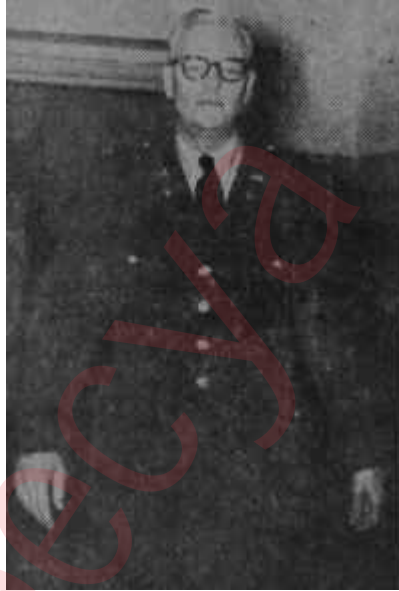
Albay Morrison Sanık iskemlesinde

Hadise 5 Kasım 1959 akşamı Çankayada cereyan etmiş, yolun kenarında yürümekte olan altmış kişi-