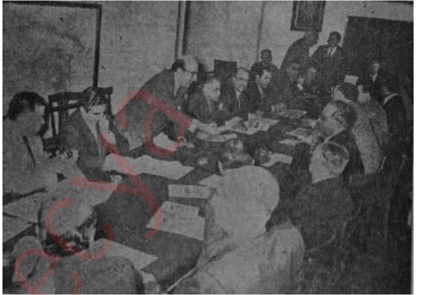
C.H.P. Meclisi çalışıyor Çıt çıkmadı

Bu sözler gazetelerde, meselâ kıymetli iş adamı biraderinin D.P. saflarını şereflendirmesini takiben