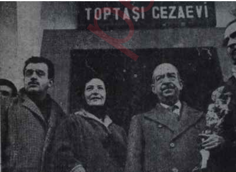
Yalman, Toptaşı cezaevi önünde yakınlarıyla birlikte

Geçen haftanın tamamı ve bu haftanın başları Yalmanın akibeti karşısında sadece Türkiye'de değil, bütün dünyada duyulan teessürün etkilerinin, kulaklar değil, yürekler tarafından duyulmasıyla geçti. Üstelik Vatan başyazarı ve yaşayan Türk gazetecilerinin piri ağır şekilde rahatsızdı. Bizzat Menderes'in yakın dostu Ekrem Şerif Egeli tarafından verilmiş bir rapor Yalmanın durumunu mükemmel şekilde gösteriyordu. 72 yaş, bu! O yaşta hapisaneyeye tahammül kolay olabilir miydi? Nitekim Yalman, Toptaşın kapıları arkasına kapandıktan pek kısa bir zaman sonra rahatsızlandı ve Haydarpaşa Nümune hastahanesine nakline zaruret hasıl oldu. İki jandarma hasta başyazarın odasının kapısında yer aklılar. Yalman, bu haftanın başında orada tecrit edilmiş vaziyette bulunuyordu. Hiç olmazsa hastahane hapisane gibi soğuk ve sevimsiz değildi, Yalman öteki mahpus gazeteciler gibi tahta kerevette yatmıyor, bir somyanın zavallı lüksünü tadıyor, yakınlarıyla rahat görüşebili-