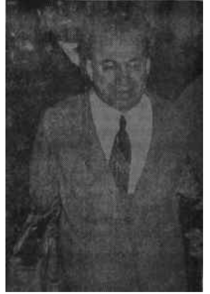
Emin Kalafat Tekrar sahnede

"— Bırakın canım şu resim çekmeği. Size ne bunlardan!" dedi. Sözlerine devam etmek için doğrulmuştu ki gazeteciye bir başka yerden resim çekmeğe uğraşırken ya-