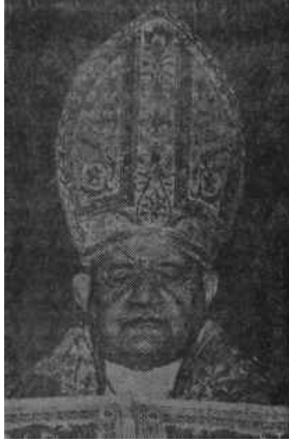
Papa XXIII. Jean Athenagoras huzursuz

Fatih Sultan Mehmedin komutasındaki kahraman Türk Orduları Bizans surları önünde tekbir getirirken Bizanslılar, Türk Ordusuyla uğraşmaktan çok, aralarındaki dinî ihtilâflar yüzünden kavga etmekle meşguldüler. Türklerin Peygamberin gösterdiği hedefi -İstanbul- o zaman İslâm Dünyasının en başta gelen temsilcileri olarak ele geçirmek için giriştikleri savlete karşı durmak emeliyle Bizans İmparatoru -Ortodoks- Konstantin Paleolog XI. katolik Avrupanın yardımını sağlamağı zaruri görmüştü. İmparator bu maksatla Papa Nikola V ile müzakerelere girişmiş ve Ortodoks Kilisesinin tekrar Roma Papasının hâkimiyeti altına sokulması için bir anlaşma yapmağı teşebbüs etmişti. İmparator, Türklerin şiddetli baskısı altındaydı. Bu yüzden müzakereler iyi gitmişti. Anlaşma yapılmak üzereydi. Esasen 14 yıl önce Floransa Konsilinde iki Kilisenin temsilcileri, birleşmek için prensip kararına da varmışlardı. Bu karar, bir yandan Katolik Papasının, diğer yandan Bizans İmparatorluğunun baskısı sayesinde verilmişti. Fatih Sultan Mehmedin dayanılmaz askerleri surların önündeyken, Doğu Roma İmparatorluğunun batmasını son dakikada önlemek ancak Avrupa Haçlılarına Bizansın kurtarılmağı değer bir din kardeşi olduğu kanaatini vermekle mümkündü. Konstantin XI de, Nikola V de Türk Ordularının Bizans surları önünde mağlûp edilmelerinde aynı menfaatleri haizdiler. Anlaşma bir an önce yapılmalıydı. Papa Nikola V bu maksatla, o zaman Kato-