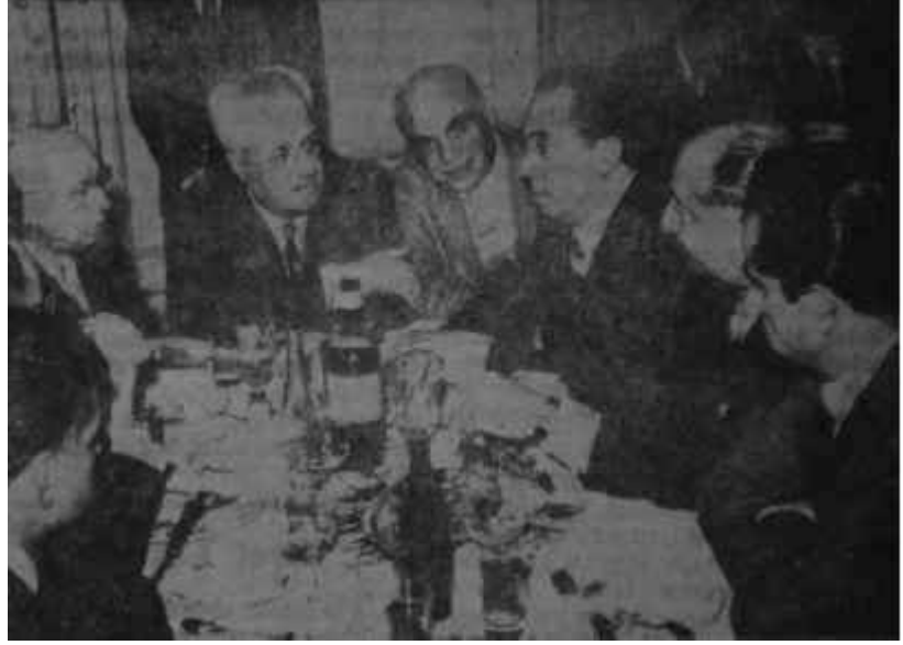
Ticaret Odası tarafından Menderes şerefine verilen yemek On yılın hâdisesi!

Öyleyse kaybolan eşiği tekrar buldurup fakiri sevindirmenin tam sırasıydı.