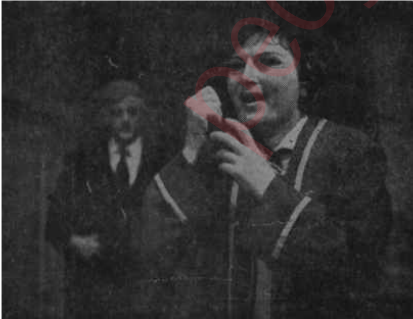
"Çöl Faresi" nden bir sahne Gişenin kasası doluyor

İşte "Çöl Faresi" nin İstanbul seyircisinden gördüğü rağbete karşılık tenkidden gördüğü bazı küçümselerde bu gerçeğin unutulmuş olmasının tesirleri var. Şüphe yok ki eserin dört başı mâmur bir komedi olduğu ileri sürülemez. Çok güzel başlayan bir birinci perdeden sonra, eser zayıflamakta, Viyanada bir büyük bankanın idare meclisi başkanının odasında geçen mali çevrenin havası, Pariste büyük bir otelin hususi dairesinde geçen son perdelerde bir vodvil çevresine inkılap etmektedir. Üstelik piyes hayli eskimiştir. Birinci Dünya Harbinden sonra Viyanada uzun zaman sürmüş olan mali kriz ve işsizlik devrinin havası bugün, zamanındaki kadar kuvvetle