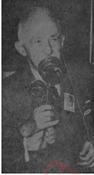
İsmet İnönü Mesuliyet arifesinde

B u yüzdendir ki AKİS'in meşhur Seçim Haritası geçen hafta içinde Genel Merkezin koridorlarında konuşulan başlıca mevzu oldu. İllerinde D.P. nin kazanacağı tahmini yapılan veya ortada olduğu söylenen yerlerin başkanları şiddetle itiraz ediyorlardı. Orada da C.H.P. kuvvetliydi, orada da D.P. yere serilecekti. İl temsilcileri lâfa böyle başladıktan sonra mucip sebeplerini ileri sürüyorlardı. Tabii bu sebeplerin hepsi inandırıcı olmaktan uzaktı. Ama başkanların imanını, inancını belli etmek bakımından alâka uyandırıcıydı. Muş gibi, Diyarbakır gibi, Siirt gibi "ortada iller" in başkanları bir formül buldular: Yerlerine döndüklerinde arkadaşlarını toplayacaklar ve "Bizim ilde kim kazanacak?" diye soracaklardı. Arkadaşları "Biz" diye cevap vereceklerdi. Zira, ifadelerine nazaran AKİS yanılmıştı ve hakikat kendi söyledikleri gibiydi. O zaman arkadaşlarına diyeceklerdi ki "Bakınız, bizim ilimizi bile altıoklu bayrağa sarmamışlar! Düşününüz, bu bayrağa sardıklarında C.H.P. nin kuvvetini!" Buluş memnurluk uyardırdı ve Seçim Haritasında sarı, siyah veya benekli renkleri taşıyan illerin temsilcilerinin AKİS'e söylenmelerinin kısmen önüne geçti. Fakat hadise, il başkanlarının maneviyatlarını gösterme bakımından büyük alâka uyandırdı. Hiç kimse kendi ilinden D.P. nin kazanacağını kabul et-