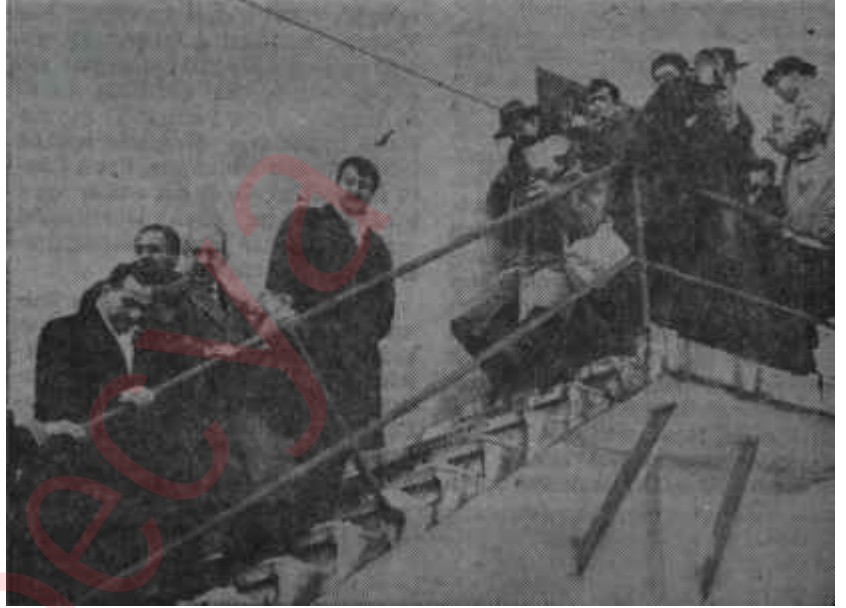
A. Emin Yalman cezaevi merdivenlerinde Hürriyete veda