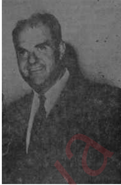
Cihat İren Medeni bir adam

Şimdi Cihat İren, vatandaşlarının takdir nazarları altında bu perdeyi yırtıyor ve medeni insanların nasıl davranmaları gerektiğini ortaya koyuyor. Bu davranış, şüphe yok, derin akisler uyandıracak ve baskı-