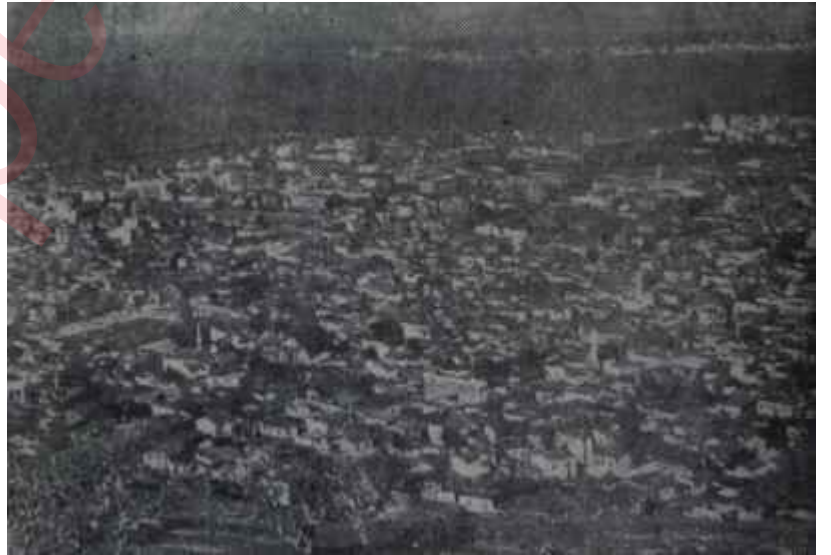
İzmirde umumî bir bakış

Üstelik, D.P. teşkilâtında hüküm süren huzursuzluk bir seçimin İstanbulda D.P. tarafından kazanılması ihtimalini kuvvetle zedelemektedir. Bu teşkilât, dış görünüşüne rağmen parça parça haldedir ve yamalı bohçaya benzemektedir.