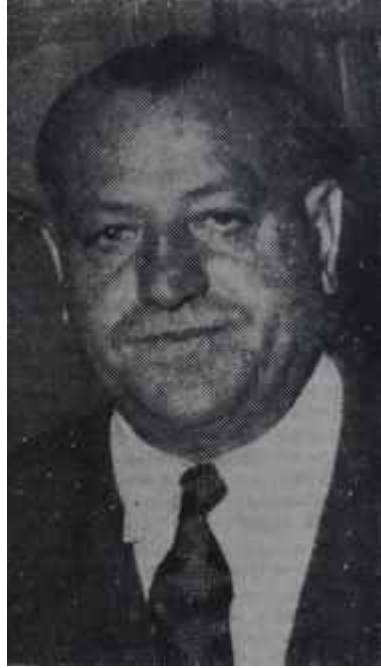
Mithat Dülge Denizdeki balığa kredi

Dünya, gazetesi bir müddetten beri Ziraat Bankasının Beyoęlu şubesi tarafından verilen bir kredi hâdise- sini ele almıştı. Gazete kredi alanın bir krom şirketi olduğunu yazıyor, fakat şirketin ismini vermiyordu. Bu- na mukabil yazılarda bir akreditif numarası açıklanmıştı. O izden yürü- yenler şirketin adını kolaylıkla bul- dular : Kromit!.. Tahkikatı daha de- rinleştirenler şirketin fiili sahibini de keşfetmekte en ufak bir zorluk çek- mediler. Oğuz Akal.. Ahmet Oğuz A- kal.. Bu isim kulaklara yabancı gel- miyordu. Ahmet Otuz Akal.. Türk Sesi gazetesi.. Evet, evet; Ahmet O- ğuz Akal sabık Devlet Bakanı Dr. Mükerrer Sarolun Türk Sesi gazetesin- deki ortağıydı. Dünya gazetesinin verdiği akreditif numarası meşhur Devlet Bakanı Dr. Mükerrer Sarolun Türk Sesi gazetesindeki ortağı Ah- met Oğuz Akal'a aitti. Kredi milyon-