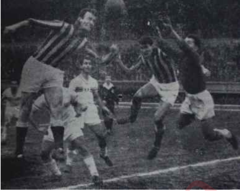
İddialı maçtan görünüş Pozun neticeye faydası olmadı