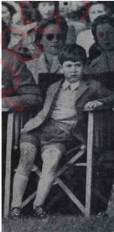
Prens Charles Veliht viski arzu ederler mi?

Bir ev halkının ihtiyacını karşılayabilecek olan bu yemek köşeleri on kişilik bir davette, tabii tamamilen battal kalır.. Buna karşı düşünülen tedbirler nedir?.. Vaktile bu gibi vaziyetlerde, ev sahibi evvelden büfe hazırladı.. Misafirler de büfeden yiyeceklerini alır. beceriklilik derecelerine göre bir yere ilişir, tabaklarını dizlerinin üstüne yerleştirir.