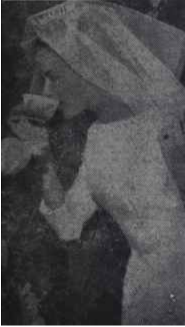
Talihli Victorie Para, güzellik, şöret

kazanmıştı. Şimdi yirmi dokuz yaşında idi.