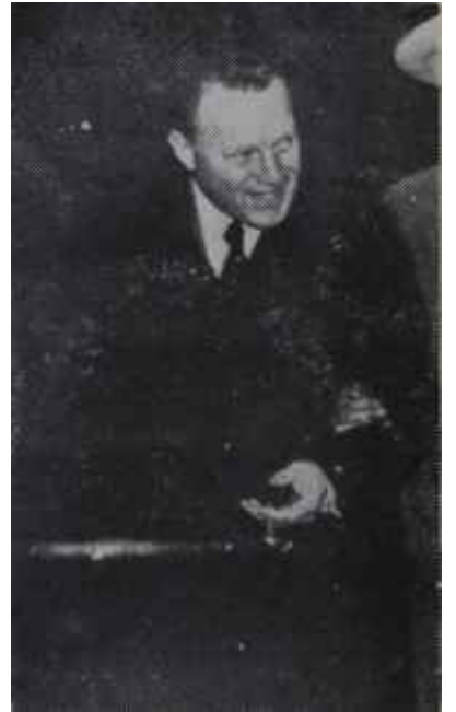
Osman Kavrakoğlu İhraç mütehassısı

Geçen haftanın sonunda Sıtkı Yırcalı Balıkesire gitmişti. Ertesi gün gazeteler eski Ekonomi ve Ticaret Bakanının istasyonda kalabalık bir kitle tarafından hararetle karşılandığını, kendisinin omuzlara alındığını ve âdetâ bir kahraman muamelesi gördüğünü yazdılar. Manzaranın dış görünüşü de hakikaten buydu. Ama işin bir de aslı vardı. Yırcalı ailesi eski Ekonomi ve Ticaret Bakanının karşılanma merasimini bir baştan ötekine tertiplemişti. Karşılایıcıların mecmuu da iki bin kişi kadardı. Vaktiyle "Sıtkı Yırcalı geliyor" diye bir haber dolaştı mi Balıkesirde dükkanında olan dükkanını kapar, evde olan