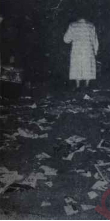
Propagandanın sonra Beyanname denizi

Aralık ayının son haftasında yapılan Sarre seçimlerinde, Sarre halkının Almanya'ya karşı beslediği sempati bir kere daha tezahür etmiştir. Almanya ile birleşme taraftarı olan üç büyük parti - Hıristiyan Demokratlar, Sosyal Demokratlar ve Hür Demokratlar - oyların % 63 ünü kazanmış bulunmaktadır. Hoffmann'ın Halk Partisi ancak on üç sandalye kurtarabilmiştir. Oysa ki geçen Mec-