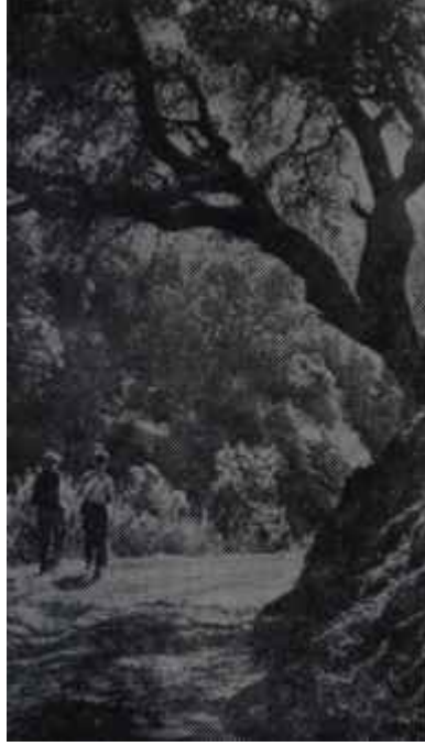
Ormanlarımızdan görünüş Yeni bir kredi sahası

7 — Zirai istihsalın arttırılmasına paralel olarak hasılanın daha iyi değerlendirilmesi için sanayi kurulmasına da çalışılmalı ve bu yoldan istihlak ve ihracatımızla arttırılmalıdır.