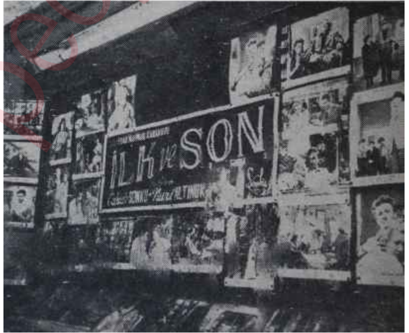
Bir sinemanın vitrini Pahalılığa uymak meselesi

Buna mukabil İstanbul Belediyesi sinema tarifelerini çoktan beri yeni duruma göre ayarlamıştır. İstanbul'da Büyük Sinema ile mukayese edilebilecek hiç bir sinema olmadığı herkesce bilinen bir hakikattir. Her türlü teknik şartlar düşünülerek yapılmış olan Büyük Sinemada, Avrupa'da bile pek ender sinemalarda bulunan soğuk hava tesisatı dahi vardır. Milyonlara mal olmuş bulunan bu sinema yedi seneden beri 61 kuruş vasatı fiyatla çalıştığı halde İstanbul'daki - Büyük Sinemaya asla emsal olabilmesi mümkün olmayan - sinemalar 100 kuruş vasatı fiyatla çalışmakta-