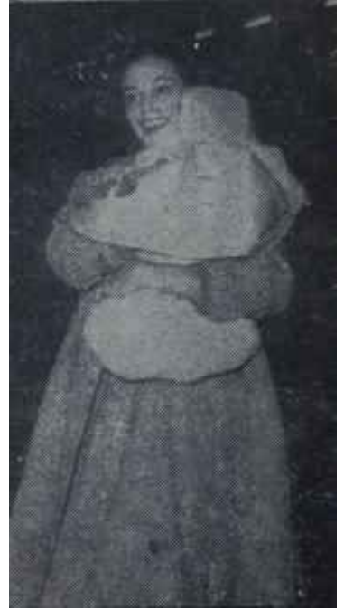
Pier Angeli En güzel hediye

Herşeyin sadeleştiği ve pratikleştiği bir devirde ziyafetlerin, mümkün mertebe basitleşeceği aşikardı ama bugün New York'ta ortaya atılan yeni yemekli davetler eski adetlerin mühim bir ihtilale tabi olduğunu göstermekte ve New York kılırdan başka, herkesi şaşırtmaktadır.