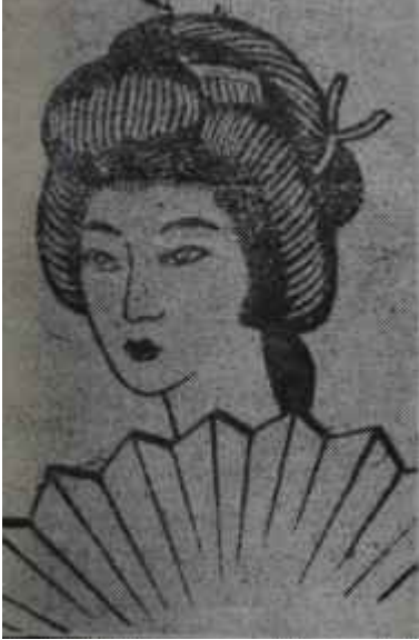
Kabuki dansözü Amerikalının bilemediği