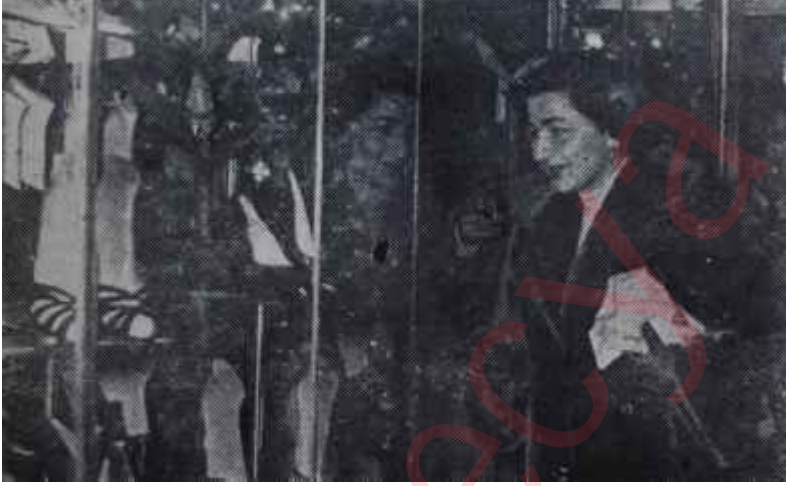
Yılbaşı gecesi için alışveriş Unutmuyoruz

yor. Saatler geçiyor. Müzik, dans, alkol ve sigara dumamı.. Baş döndürücü, hummalı bir didişme. Pudra, esans, ter kokusu.. Sonra sabaha karşı nara atarak, ağızların kenarında salyalarla, etekler çamurlarda eve dönüş. Köşe başlarında kusanlar var. Islak park sıralarında sevişenler, ağaç arkalarında sarılanlar. Kafalar mideleşmiştir. Beyinden, kalpten, kustumuk kokusu geliyor. Terle tuzlu bir madde değil irin çıkmaktadır. Hisler ishal halinde: santonin almış gibi herkes kurdunu döktü. Çöpçüler yollardan askarid toplasınlar. Yarı aralık kapıldan yarım yamalak tangolar, mambolar dökülüyor. Stradivarius'un kemanında: "Kâtip uykudan uyanmış gözleri mahmur.", "Kara biberim, biberim, biberim, Jandarmalar geliyor, cızlam edelim." şarkıları. Ünlü bestekârların yukarda muhteşem yıldızlar gibi parlayan ruhları bir müziğin ke-