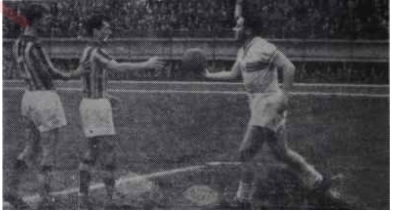
Adalet: 1 — Fenerbahçe: 0 Buyrun bir mağlubiyet

maçlarının birinci devresi nihayetlenecek ve takımların durumları açıkça belli olacaktır. Şimdiki vaziyette bir maçı eksik olmasına rağmen Galatasaray 13 puanla lider durumdadır. Kendisine en yakın olan Fenerbahçeyi bir puan geçmektedir. Üçüncü durumda bulunan Beşiktaşın da bir maçı eksiktir ve 12 puanı vardır. Onun Beyoğlusporu yenmesi normal olur. Fakat Galatasaray'ın Beykoz maniasını aşacağı peşinen söylenemez. Çünkü Sarı-Siyahlı takım son defa İstanbulsporla berabere kalmış olmasına rağmen 11 puana sahiptir ve dördüncü durumdadır. Mevsim içinde kazandığı başarılar ise - büyük