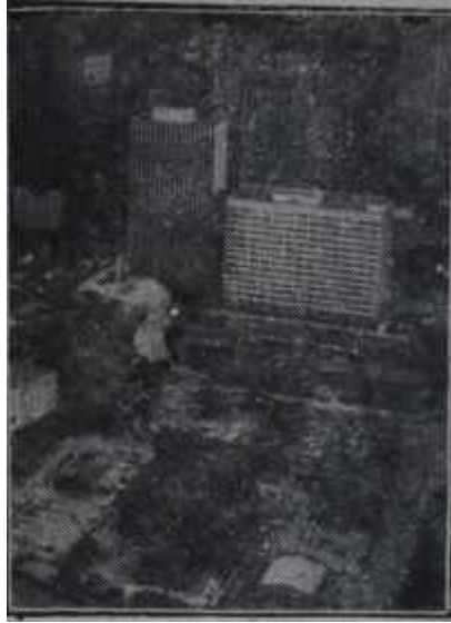
New-york'tan manzara Mide nizamında değişiklik

sallıyarak değil, geniş bir kâsede, kaşıkla karıştırılarak yapılır.. Ve bir dilim limon, bir yeşil zeytinle beraber ikram edilir.. İçki tabii buzlu dur.