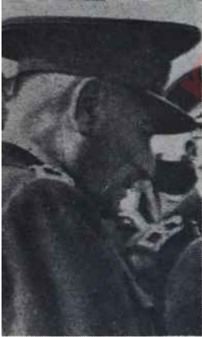
General Aknoz İş bitmek üzere

Örfi İdare Komutanlığı tarafından yapılan tahkikat aşağı yukarı bitmek üzeredir. Deliller toplanmış vaziyettedir. Yakında dosya mahkemelere intikal edecektir. Yalnız bu ara-