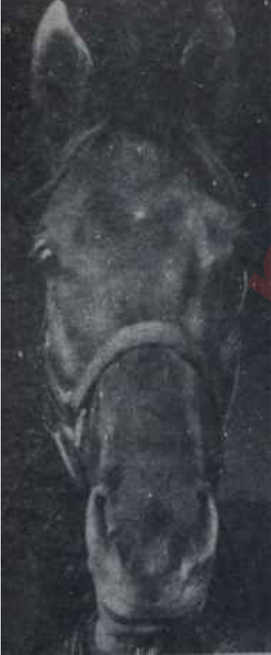
Fanfaron : IV

Hayvancağız mezbahaya götürüldü fakat kendisine reva görülen bu hareket, hiç te hoşuna gitmiş benzeriyordu.. Kibarlıkla birşey elde edemeyeceğini anlayınca, etrafına tekemeler atmaya başladı.. O derece ki, onu yakalayıp kesmeye kimse cesaret edemedi.. Bu sırada beş yaşında bir çocuk. M. Auteroche'un beş yaşındaki - ki ihtimal bir başka dahi çocuktu - torunu Gerard :