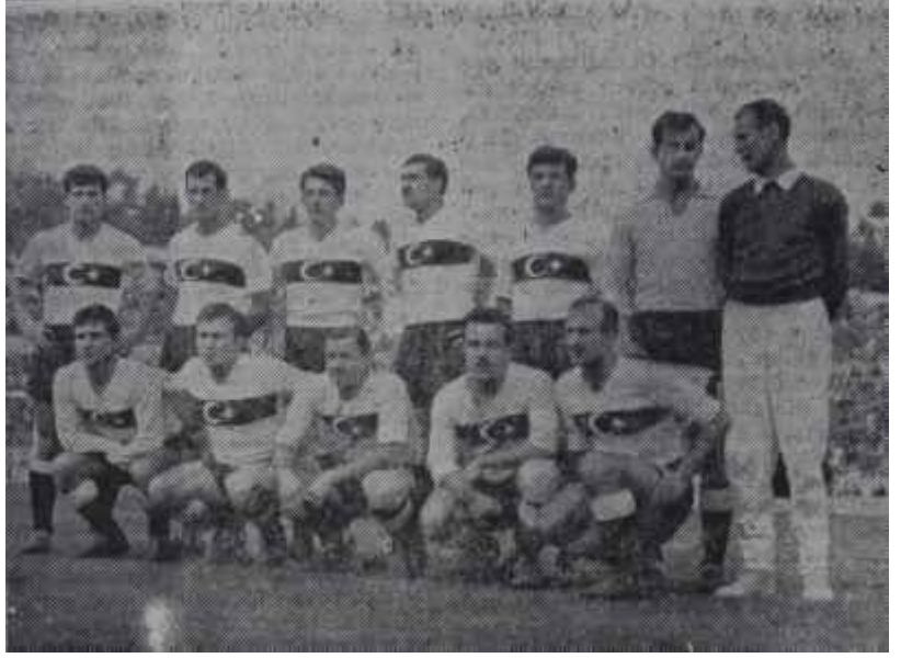
Milli Takım Portekiz maçından önce