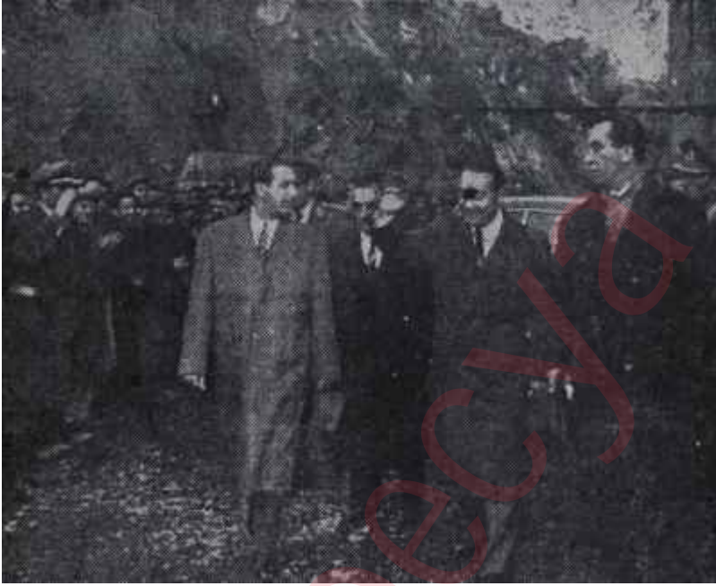
Menderes Zonguldak'ta Makinelere politika sıkıştı

Meclis Tahkikat Komisyonunun faaliyeti bugünlerde en alâka uyandırıcı safhasına girmek üzeredir. Uluzın haftalardan beri tâli komisyon halinde İstanbulda çalışan milletvekilleri orada gerekli delilleri bulmuş-