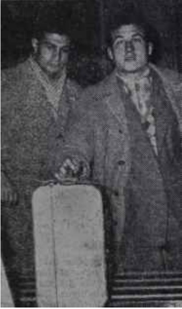
Milli Takım döndü Turizm geliyiyor

ba günü bundan dolayı büyük pişmanlık duydular. İtalya'nın karşısına çıkan Türk Ordu takımı sanki birkaç gün evvel seyrettikleri süratli, deplasmanlı futbol oynayan takım değildi.