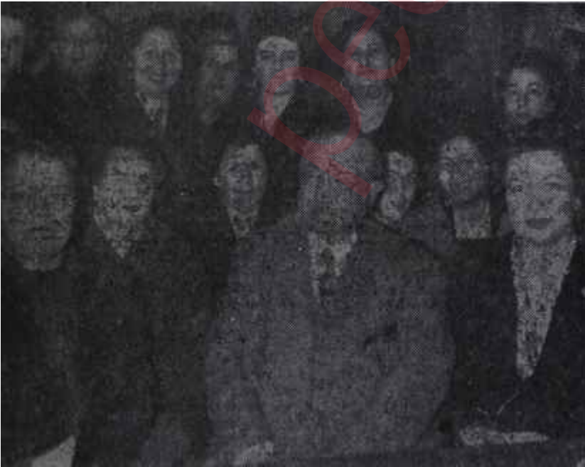
Günaltay C. H. P. li kadınlar arasında "Zulmetten Nura"

Cemiyetteki bu faal vazifesinden başka kadının' anne olarak da çok mühim bir vazifesi vardı: çocukları-