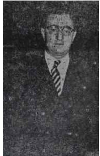
Daniş Koper Çorbada tuzu var

ve temel inşaatına devam olunmuştur. Karayolları bu işte takdire layık bir gayret göstermiş ve uzayıp giden inşaatın daha fazla uzamaması için lüzum gelen tedbirleri almış ve 1955 yılı içinde azami derecede faaliyet gösterilmesini temin ederek, köprüünün en mühim kısmı olan 57 metre açıklıkta beş kemer inşaatının bitirilmesini sağlamıştır. Kemelerin inşası için kısmen demir kafes kiriş, kısmen de ahşap kasıklar üstüne iskeleler yapılmıştır. İnşaat bu safhada iken temellerde fazla artış olduğundan işin yüzde 20 nisbetini tevavi edeceği anlaşılmış ve mukavele mucibince tasfiye edilerek geri kalan kısmı yeniden ihaleye konmuştur. İnşaatın seyrine engel olmadan lüzum gelen muameleler tamamlanmış ve ikinci kısım inşaat da aynı müteahhit firma tarafından 16 Mart 1956 da ikmal edilmiştir.