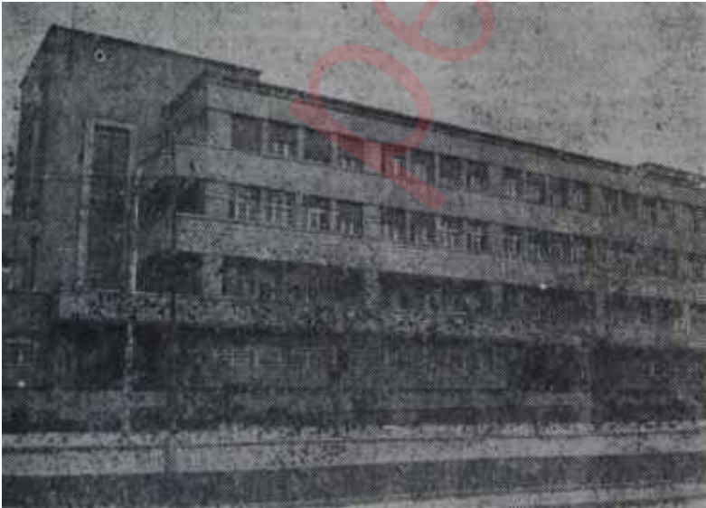
İsmetpaşa Kız Enstitüsü Çocuk psikolojisine kapısı kapalı mı?