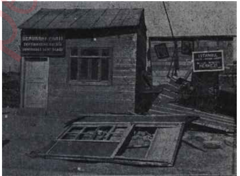
Bir partizanlık örneği