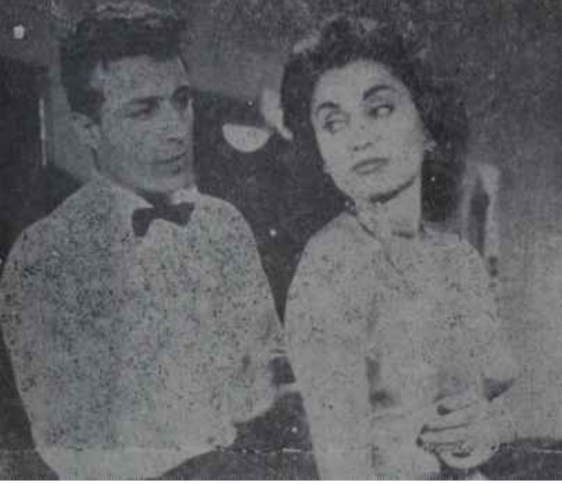
M. Özkul ve A. Karındaş "Kalbimin Şarkısı"nda "Bitmeyen Şarkı" olmalıydı

ra, senaryoya borçlu olan ve bunu diğer filmlerinde ispat eden rejisörler sayılabilir; Henry King, Robert Wise, Robert Hamer gibi.