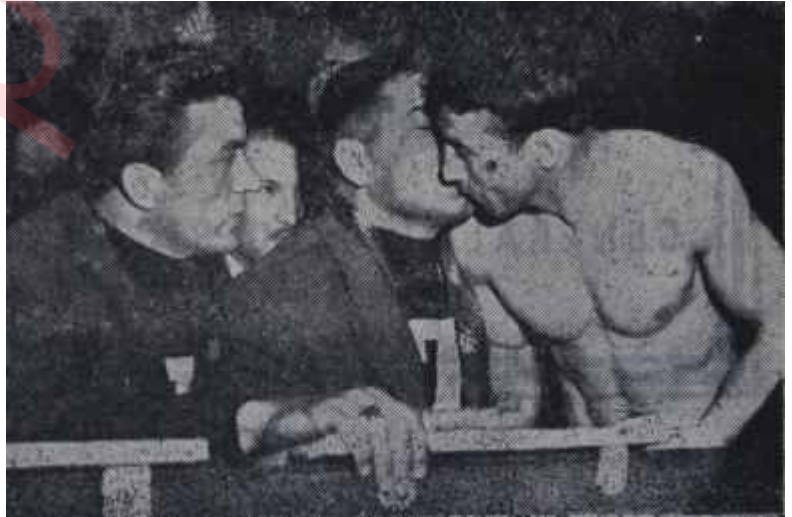
Güreşimizin büyük şampiyonları Gençler yerlerini doldurabilecek mi ?

Güreş Federasyonu Başkanı Vehbi Emre'nin evvelce açıkladığı programa uyularak geride bıraktığımız hafta içinde Spor ve Sergi Sarayında evvela greko-romen ve sonra da serbest güreş birincilikleri yapıldı. Muhtelif bölgelerin iştirak ettiği Türkiye çapındaki bu müsabakalarda elde edilen neticeler güreşte otorite mesabesine yükselen şahısları memnunet-