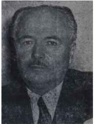
F. Lütfi Karaosmanoğlu İki yolun ağzında

Zira böyle konuşan Hür. P. mensupları bile pek ala fark ediyorlardı ki aksak bir tarafları vardı. Aksak bir taraf, daha doğrusu bir boşluk. Bu mülahazayı partiyi-kurarlar ken de göz önünde tutmuşlardı. Sebabi hikmetleri, sebebi mevcudiyetleri bir antitezdi. Partilerinin idare ediliş tarzından memnun değillerdi. Böyeleri demokratik memleketlerde partilerin bir kanadım teşkil ederler ve fikirlerini tatbik mevkiine koymak için parti dahilinde mücadele ederler. Bizde ise D.P. deki totaliter zihniyet karşısında kendilerine bu hak tanınmamış ve ihraç edilmişlerdi. Bu yüzden dışardan çalışmak mecburiyyetinde bırakılışları bir handikapı. Aşında partililere - Demokratik Partililere - söylemek mevkiinde oldukları sözleri şimdi' millete söylemek zorundaydılar. Nefesleri ise henüz bunu lâykıyla yapacak kadar kuvvetli değildi. Çünkü bu memlekette iki büyük siyasi kuvvet vardı: D. P. ve C. H. P. bunların arasında bir takım küçük partiler ancak zaman zaman ve geçici şartlar icabı kendilerini hissettirebilirlerdi. Hür. P. ne müs takil parti olarak bir şans yoktu. AKİS, daha partinin kuruluşuna tekadüm eden haftalarda "İspatçılar ancak D. P. yi boşaltıp onun yerini alırlarsa bir kuvvet olurlar ye bunu yapmak imkânına sahiptirler" diyor du. Kanaatimiz değişmemiştir. Nitekim hadiseler o istikamette cereyan etmediği içindir ki Hür. P. sağlam temeller üzerine oturmamıştır. Bir