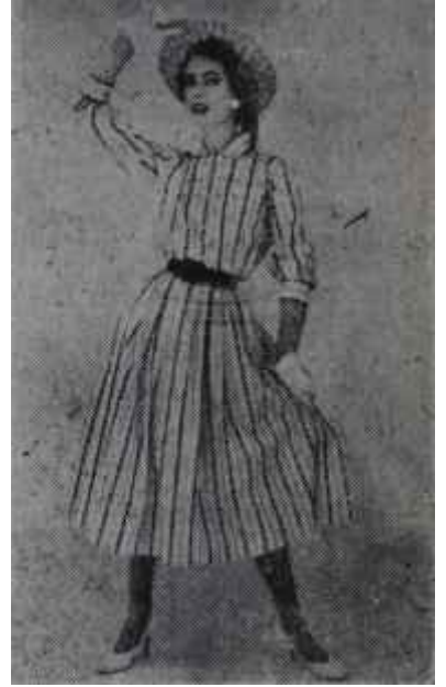
Beyaz ayakkabı ve eldiven

"— Ekonomik giyim modayı takip etmemek değildir sevgili okuyucu.. Ekonomik giyim, bir hiçle, modaya uymasını bilmektir.. Bilir misiniz ki, siz evdeki eski elbiselerinizle bile bazan "Dior" un son icat ettiği hattı elde edebilirsiniz. Moda herşeyden evvel çizgi ve silüet demektir. Modaya uymak kadının maneviyatını düzeltir, ona yaşama zevki, saadet arzusu verir. Ufak bir gay-