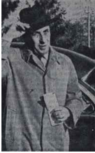
Muammer Çavuşoğlu Kalkınma Bakanı

Cumhuriyetin onuncu yılında, 1933 de Birecik köprüsü işi tekrar e- le alınmıştı. Yeniden projeler hazırlan- dı. 512 000 liralık bir de keşif yapıldı. Fakat kafi tahsisat olmadığı